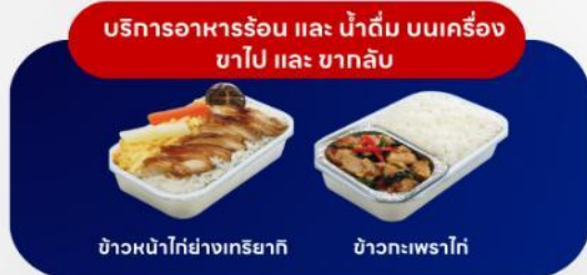
บริการอาหารร้อน และ น้ำดื่ม บนเครื่อง ขาไป และ ขากลับ