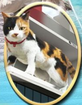
ซอยบิจิ ซินจูกุ