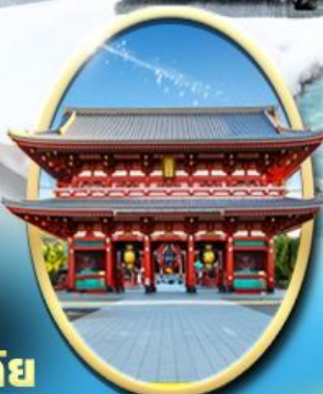
วัด เซ็นโซจิ