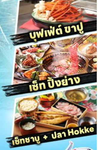
บุฟเฟต์ ซาซุ