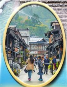
เมืองเก่า ทาคายามา