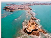
ป้อมปราการซานเซบัสเตียน