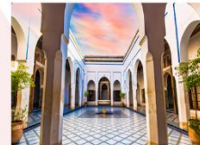
พระราชวังบาเอีย

** พักที่ Palais Riad Bèrbè Hotel 4* หรือเทียบเท่า **