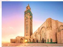
สุเหร่าฮัสซันที่ 2

12.00 น. สมควรแก่เวลานำท่านเดินทางสู่สนามบินคาซาบลังกา (CMN) 16.45 น. ออกเดินทางสู่อิสตันบูล ประเทศตุรกี โดยสายการบินเตอร์กิชแอร์ไลน์ เที่ยวบินที่ TK 618 23.25 น. เดินทางถึงสนามบินอิสตันบูล (แวะเปลี่ยนเครื่อง)