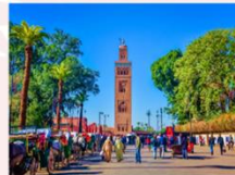
เมืองมาราเกช