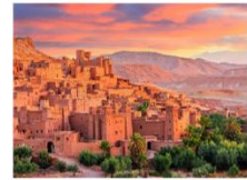
Kasbah Ait Ben Haddou

** พักที่ Oscar Hotel by Atlas Studios Hotel 4* หรือเทียบเท่า **