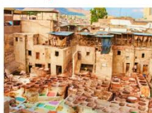
เขตเมืองเก่าเฟซ