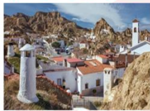
Barrio de Cuevas