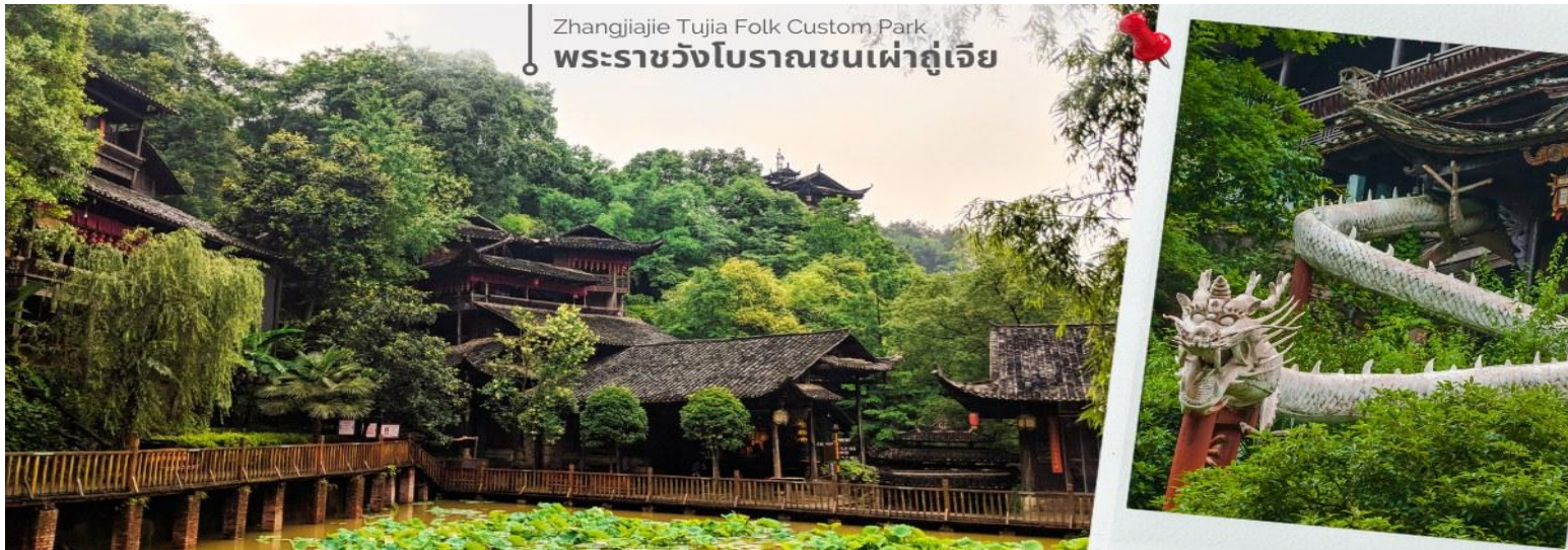
Zhangjiajie Tujia Folk Custom Park พระราชวังโบราณชนเผ่าถู่เจี๋ย

นำทุกท่านเดินทางสู่ พระราชวังโบราณของชนเผ่าถู่เจี๋ย เป็นสถานที่ท่องเที่ยวที่สำคัญในเมืองจางเจี๋ยเจี๋ย ประเทศจีน ซึ่งเป็นที่อยู่อาศัยของชนเผ่าถู่เจี๋ย. ภายในพระราชวังมีการแสดงวิถีชีวิต พิธีกรรม และวัฒนธรรมของชนเผ่าถู่เจี๋ย. นอกจากนี้ยังมีอาคาร 9 ชั้นที่สร้างจากไม้ ซึ่งเป็นที่พำนักของเจ้าเมืองในอดีต ซึ่งปัจจุบัน สามารถขึ้นไปชมได้ แต่แต่ละชั้นจะมีแสดงเสื้อผ้าของใช้ของฮ่องเต้ รวมถึงของพื้นเมืองให้เราได้ดู ด้านบนสุดเห็นวิวเมืองด้วย สวยงาม และด้านหลังยังมีอาหารใหม่ที่สร้างหลังอาคารใหญ่ๆ จะมี 2 อาคาร มีป่อน้ำตามีหลักฮวงจุ้ย