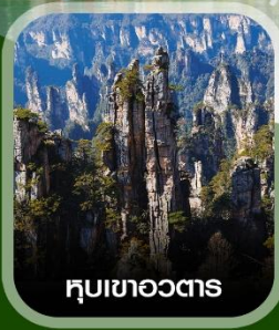
หุบเขาอวตาร

ฟรี ใส่ชุดชนเผ่าท้องถิ่น บินตรงลงจางเจียเจีย