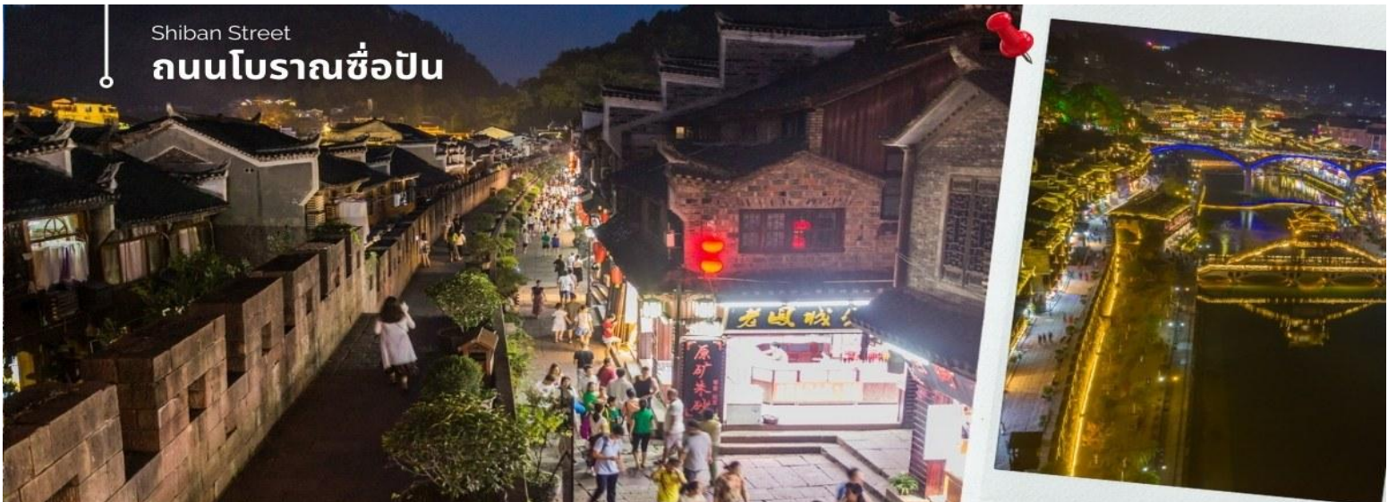
Shiban Street ถนนโบราณชือป๋น

นำท่านเดินทางโดยรถโค้ชปรับอากาศเข้าสู่ เมืองโบราณเฟิ่งหวง (เมืองหงส์) ใช้เวลาเดินทางประมาณ 3 ชั่วโมง เดินทางถนนโบราณ Feng Hueng Ancient Town ที่ถนนชือป๋น Shiban Street เมืองที่ยังคงรักษาเอกลักษณ์ความเป็นพื้นเมืองผสมผสานกับยุคปัจจุบันเอาไว้ได้อย่างลงตัววิถีชีวิตของชาวบ้านที่อาศัยอยู่ที่นี่ บรรยากาศในเมืองเฟิ่งหวง ถนนเก่าชือป๋นเป็นถนนปูหินแคบๆ กว้างไม่ถึง 5 เมตร ทอดยาวจากทางเข้าวัดเต้าเหมินไปทางทิศตะวันตก ผ่านถนนหลายสาย ได้แก่ ถนนครอส ถนนเจิ้งตะวันออก ถนนเจิ้งตะวันตก ศาลาฮุยหลง หียงเซียวซง เต้าซานลา ศาลาเจี๋ยกั๋ว และสุสานเซินฉงเหวิน สุดท้ายจะนำไปสู่ “น้ำพุแรกใต้ฟ้า” ถนนสายนี้มีความยาวกว่า 3,000 เมตร และเป็นย่านการค้าที่คึกคักที่สุดในเฟิ่งหวง