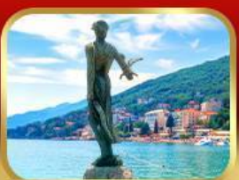
ราชินีแห่งอาเดรียติก โฟพาทิช