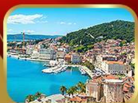
ชมย่านเมืองเก่าสปลิท

14-21 พ.ค. ปรับลดจาก 75,555 18 ที่สุดท้าย 73,333.-