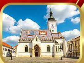
โบสถ์เซ็นต์มาร์ก ซาเกรบ