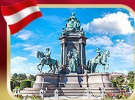
จัตุรัสมาเรียเทเรซา เวียนนา