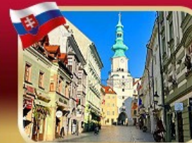
ย่านเมืองเก่า บราติสลาวา