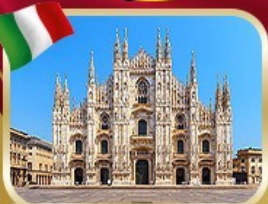
มหาวิหารดูโอโม เมืองมิลาน