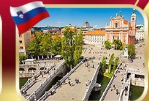
สะพานทรปีเปิล ลูบลยานิกา