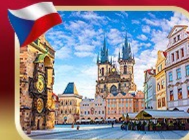
เที่ยวจัตุรัสเมืองเก่า ปราท