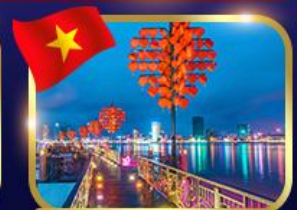
สะพานแห่งความรัก ดานัง