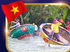
ล่องเรือกระด้ง หมู่บ้านกิมถาน