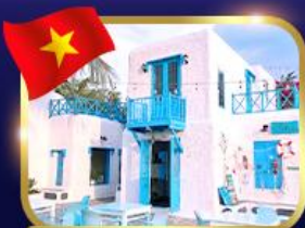
คาเฟ่สไตล์ซานโตรินี่ ชันทรา มาริน่า