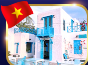
คาเฟ่สไตล์ซานโตรินี่ ชันทรา มาริน่า