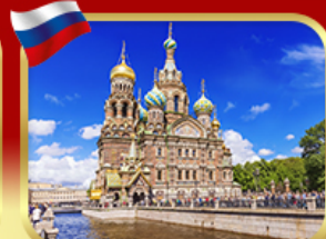
เข็ควินโบสถ์แห่งหยดเลือด