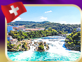
ชมความงดงาม น้ำตกไรน์