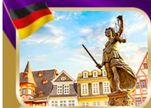
จัตุรัสโรเมอร์ แฟรงก์เฟิร์ต