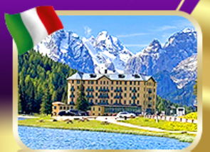
ซีคอิน ทะเลสาบมิซูรีน่า