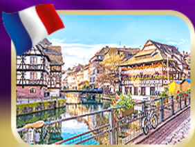
เที่ยวอัลซาส สตราสบูร์ก