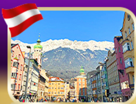
เที่ยวเมืองเก่า อินส์บรุค