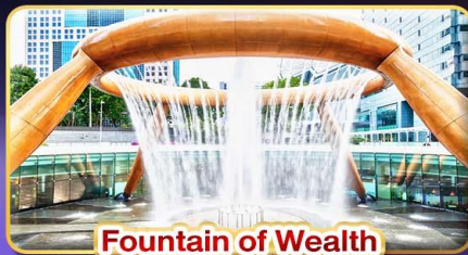
Fountain of Wealth