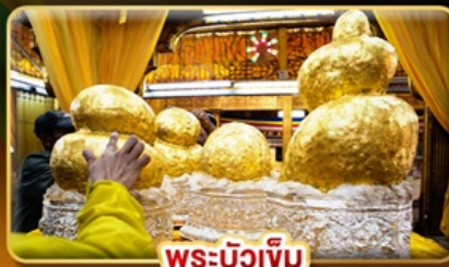
พระบัวเข็ม