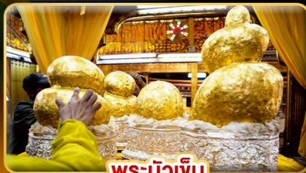
พระบิ๊วเข้ม