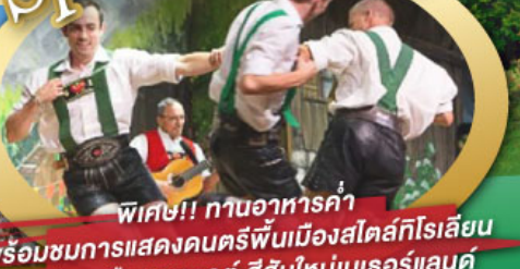
พิเศษ!! ทานอาหารค่ำ พร้อมชมการแสดงดนตรีพื้นเมืองสโตร์ทโรเลียน และเยือนเมืองอูเทรคต์ สีสันใหม่เบียร์แลนด์

ไฮไลท์ในโปรแกรม • เยือนเมืองแห่งแคว้นบาวาเรีย และ ทิโรล • สนุกสนานเหมืองเกลือบิรชเทสกาเดิน • เข้าชมปราสาทนอยชวานสไตน์ • เดินเล่นจัตุรัสโรเมอร์ ซอปปิง Zeil Street • ถ่ายรูปมุมมองของหมู่บ้านอัลสติก • ชิลๆ ไปในเมืองซาลสบูร์ก บ้านเกิดโมสาร์ท 25 ก.ย. - 04 ต.ค. 69 • ล่องเรือหมู่บ้านทึร์น และ ล่องเรือชมนครอัมสเตอร์ดัม 09-18, 16-25 ต.ค. 69 • ซอปปิงจุ้ย่านคัมสแควร์และเดินเล่นย่านโคมแดง 22-31 ต.ค. 69 / 06-15 พ.ย. 69 GO3MUC-TG032 29 ธ.ค. 69 - 07 ม.ค. 70 * ปีใหม่ *