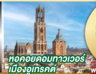
หอคอยคองทาวเวอร์ เมืองอูเทรคต์