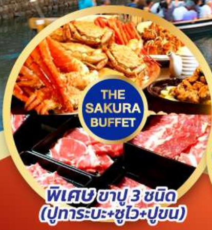
พิเศษซาปู 3 ชนิด (ปูทะเล+ปูม้า+ปูซิม)