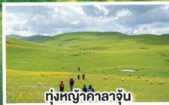
ทุ่งหญ้าคาลาจูน