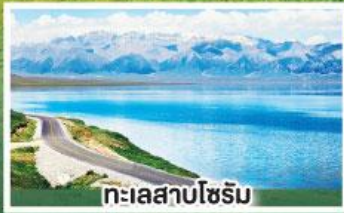
ทะเลสาบโซริม