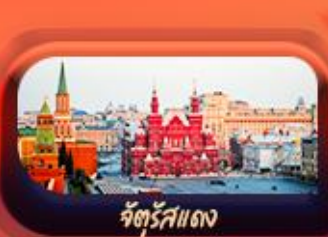
จัตุรัสแดง