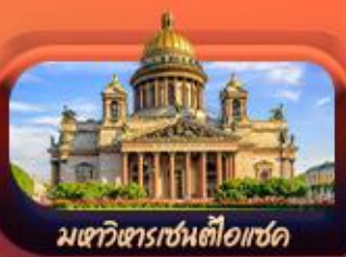
มหาวิหารเซนต์ไอแซค