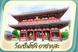
วัดเซ็นโซจิ อาซากุสะ

24-27 เม.ย.68 / 15-18 พ.ค.68 / 22-25 พ.ค.68 / 29 พ.ค. - 1 มิ.ย.68 31 พ.ค. - 3 มิ.ย.68 / 12-15 มิ.ย.68 / 28 มิ.ย. - 1 ก.ค.68