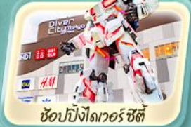
ช้อปปิ้งโตเวอร์ ซิตี้

ชมวิวภูเขาไฟฟูจิ สวนโออิชิ หมู่บ้านน้ำใสชิโนะ อักโก เยือนวัดเซ็นโซจิ อาซากุสะ ตลาดปลา Toyosu ช้อปปิ้งของที่ห้างดัง โตเวอร์ ซิตี้