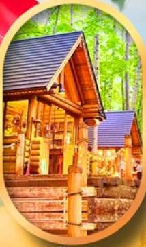
นิงเกิลทอรัส