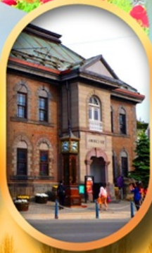
พิพิธภัณฑ์กล่องดนตรี