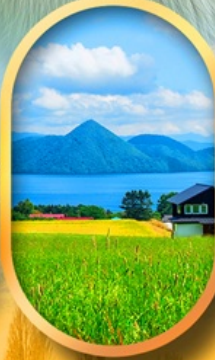
ทะเลสาบโทโยะ