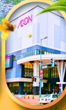
อ็อนมอลล์