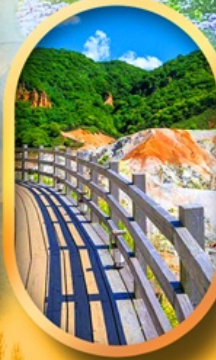
โนโบริเบ็ตสึ