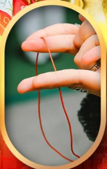
เสริมดวงความรัก