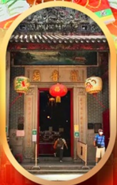
เจ้าแม่กวนอิมสองอ่า