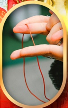
เสริมดวงความรัก