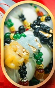
ร้านหยกอิญมณี