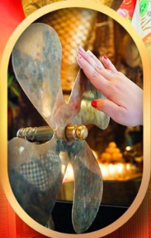
หมอนกั๊กหันแซง