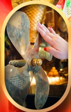
หมอนกั้งหิ้นแซง