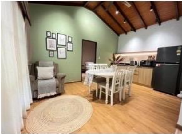
ห้องรับประทานอาหาร และ Mini bar