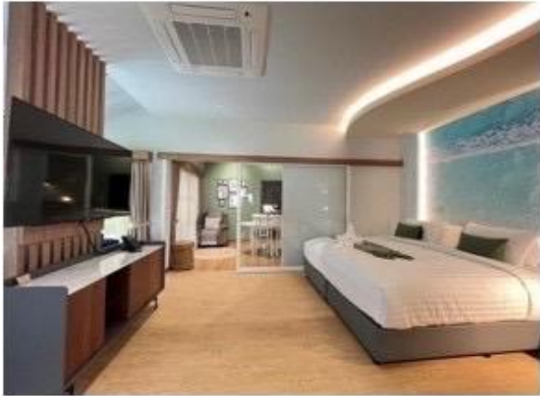
ห้องนอน Master - Bed king size