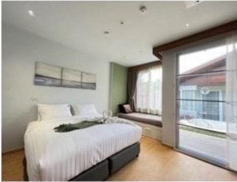
ห้องนอน Bed king size