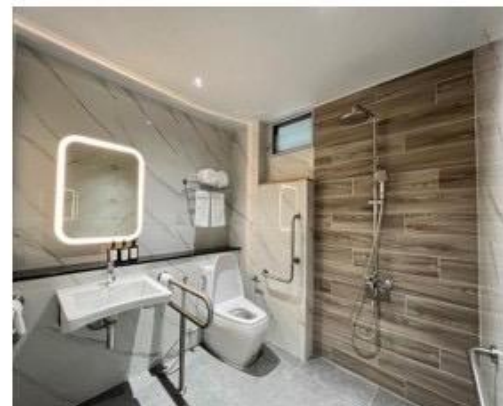
ห้องน้ำพร้อมเครื่องอำนวยความสะดวกครบถ้วน