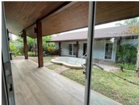
มุงพักผ่อนและแช่น้ำแร่ร้อนเค็ม