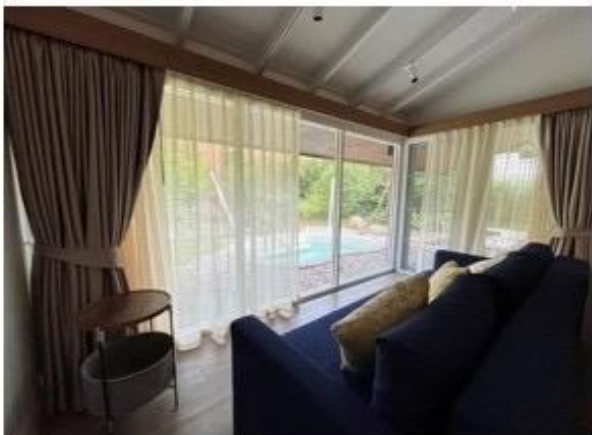
living room วิถีธรรมชาติ