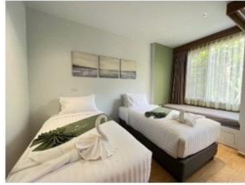
ห้องนอน Master - Bed Twin