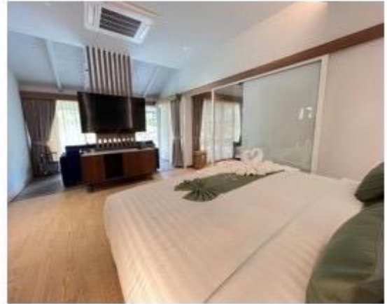
ห้องนอน Master - Bed king size