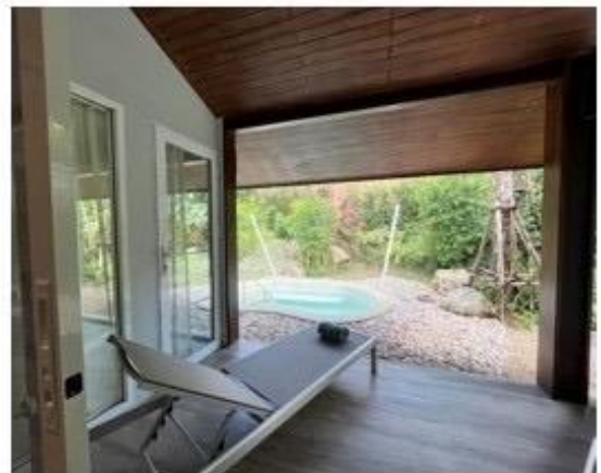
มุมพักผ่อนและบ่อน้ำแร่พุร้อนเค็ม