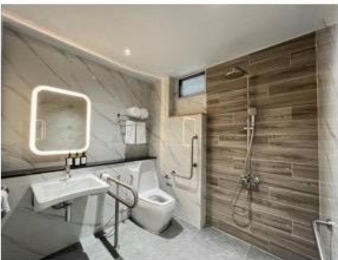
ห้องน้ำพร้อมเครื่องอำนวยความสะดวกครบครัน