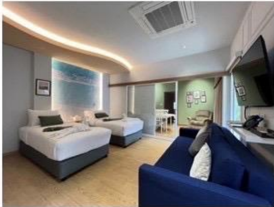
ห้องนอน Master - Bed Twin