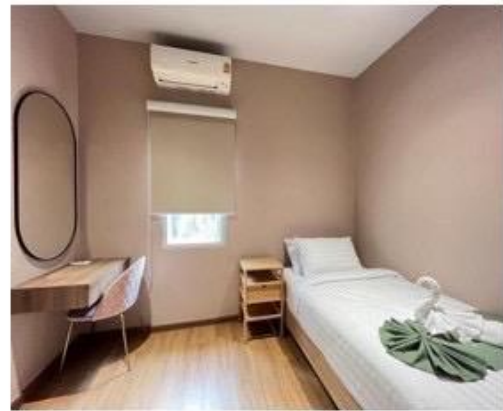
ห้องนอนเล็กมีห้องน้ำในตัว