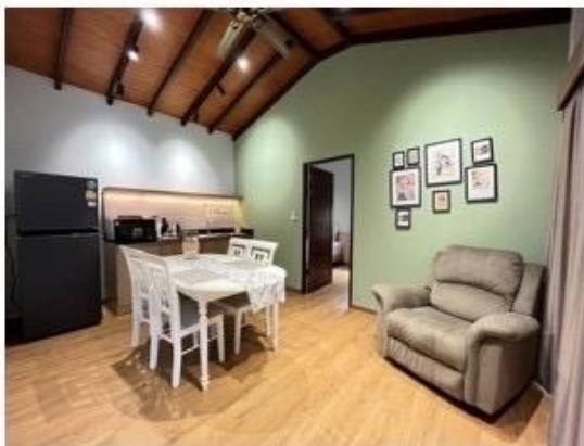
ห้องรับประทานอาหาร และ Mini bar