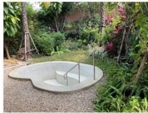
บ่อน้ำพุร้อนและแช่น้ำแร่พุร้อนเค็ม