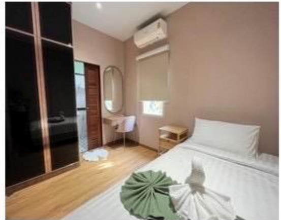
ห้องนอนเล็กมีห้องน้ำในตัว