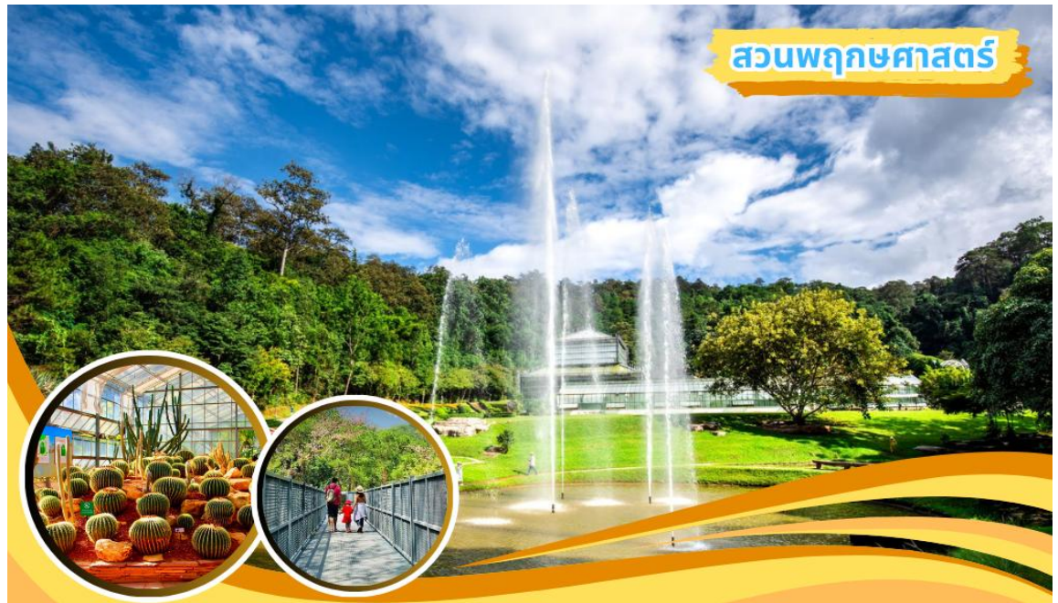
สวนพฤกษศาสตร์