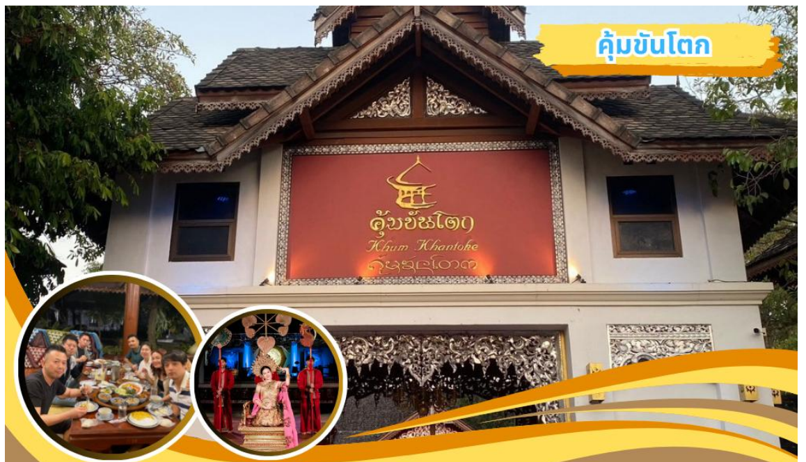
คุ่มขันโตก

นำคณะเดินทางไปรับประทานอาหารค่ำ ๑๐ อาหารค่ำ ณ คุ่มขันโตก(๑) พร้อมชมการแสดงพื้นเมืองลานนา หลังอาหารนำคณะเดินทางกลับที่พัก อิสระพักผ่อนตามอัธยาศัย