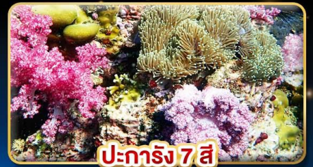
ปะการัง 7 สี