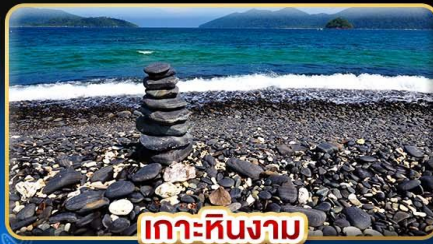
เกาะหินงาม