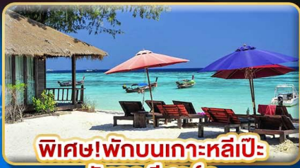
พิเศษ! พักบนเกาะหลีเป๊ะ อินคา รีสอร์ท