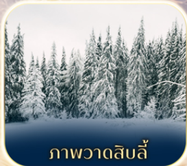
ภาพวาดสไลด์