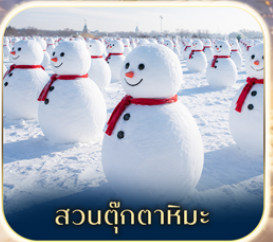
สวนตุ๊กตาหิมะ