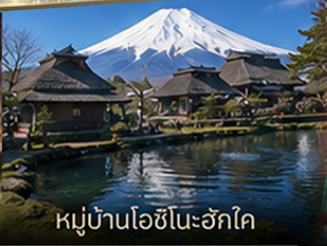
หมู่บ้านโอชิโนะอ๊กโค