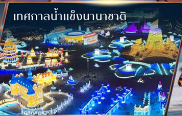
เทศกาลน้ำแข็งนานาชาติ