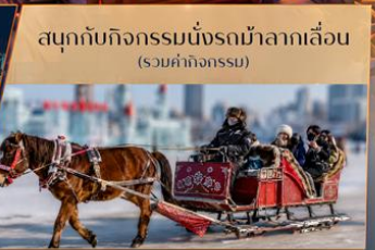
สนุกกับกิจกรรมนั่งรถม้าลากเลื่อน (รวมค่ากิจกรรม)