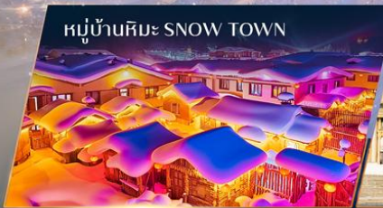
หมู่บ้านหิมะ SNOW TOWN

ควอนเฟโรมออกเดินทาง ตั้งแต่ 15 ท่าน ขึ้นไป