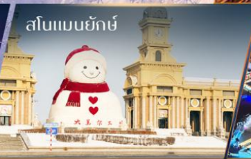
สโนว์แมนยักษ์