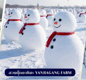
สวนตุ๊กตาหิมะ YANJIAGANG FARM