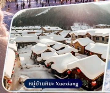
หมู่บ้านหิมะ Xuexiang