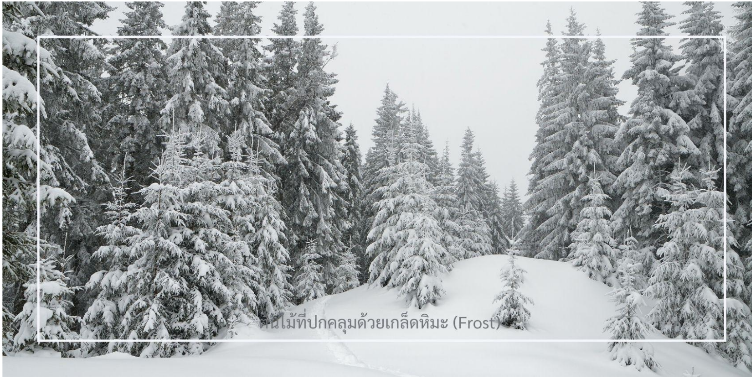
ต้นไม้ที่ปกคลุมด้วยเกล็ดหิมะ (Frost)

ยาบูลี (Yabuli) เมืองตากอากาศชื่อดังทางตอนเหนือของจีน ตลอดเส้นทาง ท่านจะได้เพลิดเพลินกับทัศนียภาพของฤดูหนาวที่งดงาม รวากับฉากในนิยาย ท่ามกลางต้นไม้ที่ปกคลุมด้วยเกล็ดหิมะ (Frost) ระเบียบระย้าราวคริสตัล สองข้างทางแต่งแต้มไปด้วยหิมะขาวนวล เป็นบรรยากาศที่หาได้ยากและงดงามจับใจในแบบเฉพาะของดินแดนภาคตะวันออกเฉียงเหนือของจีน