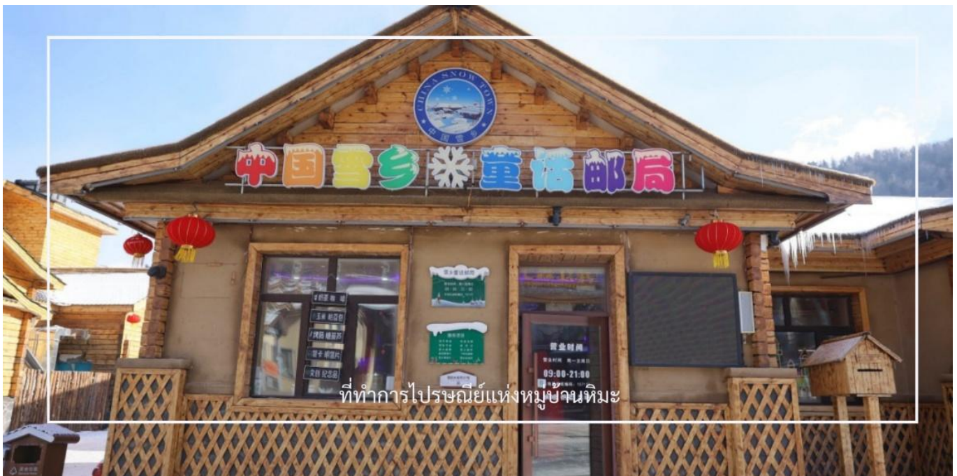
ที่ทำการไปรษณีย์แห่งหมู่บ้านหิมะ

ชม พิพิธภัณฑ์แห่งหมู่บ้านหิมะ (Snow Town Museum) เป็นพิพิธภัณฑ์ที่รวบรวมประวัติ ความเป็นมา และวัฒนธรรมของหมู่บ้านหิมะ Xuexiang จัดแสดงเครื่องมือ อุปกรณ์ และวิถีชีวิตของชาวบ้านในพื้นที่หนาวจัด ที่ทำการไปรษณีย์แห่งหมู่บ้านหิมะ อีกหนึ่งจุดเช็คอิน ที่นี่ไม่เพียงเป็นไปรษณีย์ในพื้นที่ห่างไกล แต่ยังเป็นสถานที่ที่ทุกท่านสามารถเลือกซื้อโปสการ์ดลวดลายพิเศษ พร้อมส่งถึงคนที่รัก และประทับตราไปรษณีย์เฉพาะของหมู่บ้านหิมะ ที่ไม่มีจำหน่ายในทีใด อาคารไปรษณีย์หลังเล็ก สีเขียวเข้มตัดกับหิมะสีขาว เป็นอีกหนึ่งมุมถ่ายรูปยอดนิยม