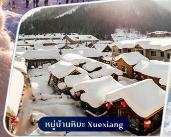
หมู่บ้านหิมะ Xuexiang