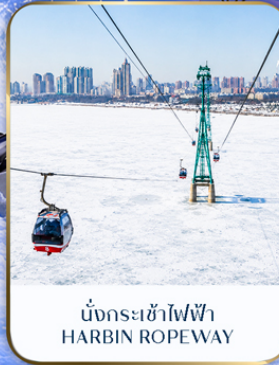
นั่งกระเช้าไฟฟ้า HARBIN ROPEWAY