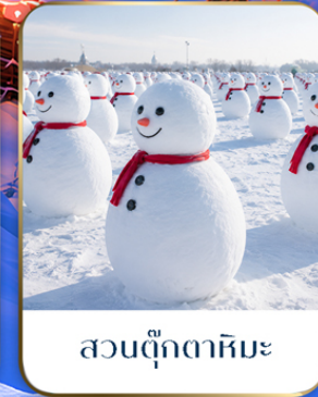
สวนตุ๊กตาหิมะ