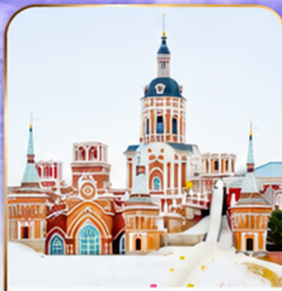
คฤหาสน์วอลการ์

รวมกิจกรรม มังกรม้าลากเลื่อน รวมสำเนา China Snow Town Dream Home รวมสำเนา ภาพวาดศิลปะ K50 Ice & Snow Gallery รวมสำเนา เทศกาลน้ำแข็งนานาชาติ