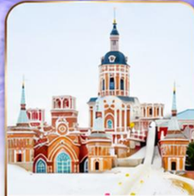
คฤหาสน์วอลการ์

นั่งรถม้าลากเลื่อน • เดินเล่นป่าหิมะ ฉายาภาพวาดสิบลี อนุสรณ์ป้องกันน้ำท่วม • ซุปปิ้งถนนบาร์จอก • ถนนจงหยาง