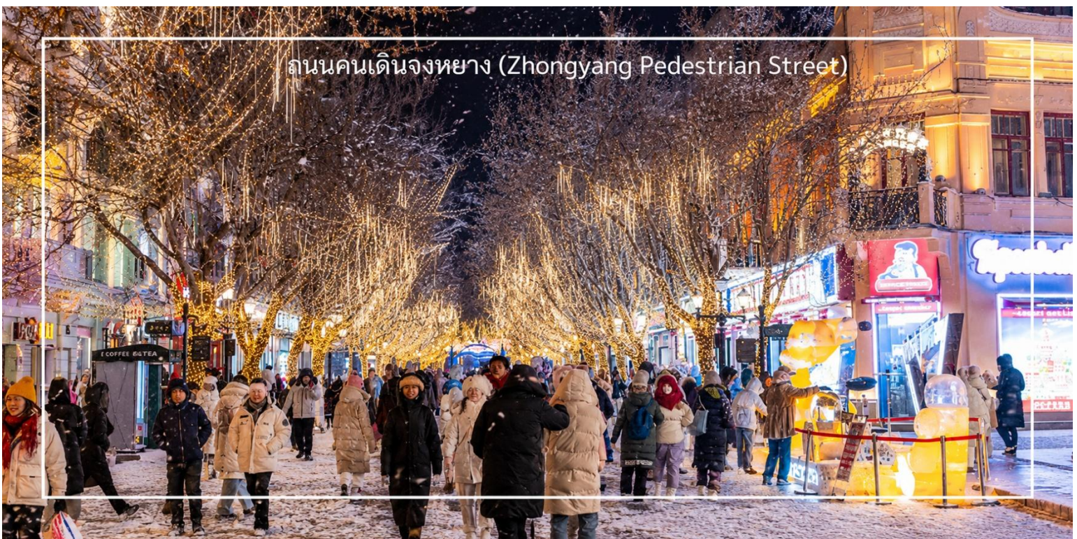
ถนนคนเดินจงหยาง (Zhongyang Pedestrian Street)

ให้ท่านอีสระช้อปปิ้ง ถนนคนเดินจงหยาง (Zhongyang Pedestrian Street) ถนนคนเดินชื่อดังของฮาร์บิน แหล่งรวมสินค้าท้องถิ่น ร้านค้า คาเฟ่ ร้านอาหาร เสื้อผ้า แฟชั่น รองเท้าและของฝากหลากหลายสไตล์ บรรยากาศยุโรปและจีนที่ผสมผสานได้อย่างลงตัว แวะชม Popmart เก็บคอลเลคชั่นใหม่ ๆ ของฟิกเกอร์สุดน่ารัก ที่สายสะสมของเล่นไม่ควรพลาด