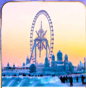
เทศกาลแกะสลักน้ำแข็ง Harbin Ice and Snow Festival