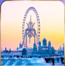
เทศกาลแกะสลักน้ำแข็ง Harbin Ice and Snow Festival