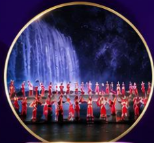
ฉากหลังธรรมชาติ สุดอลังการ

สัมผัสการแสดงกลางแจ้งสุดตระการตา Impression Wulong ผลงานกำกับโดยจางอ๋อหมว ถ่ายทอดวิถีชีวิต วัฒนธรรม และเรื่องราวของชาวฉงชิ่ง ผ่านการแสดง แสง สี เสียง ท่ามกลางฉากหลังธรรมชาติอันยิ่งใหญ่ของอู่หลง