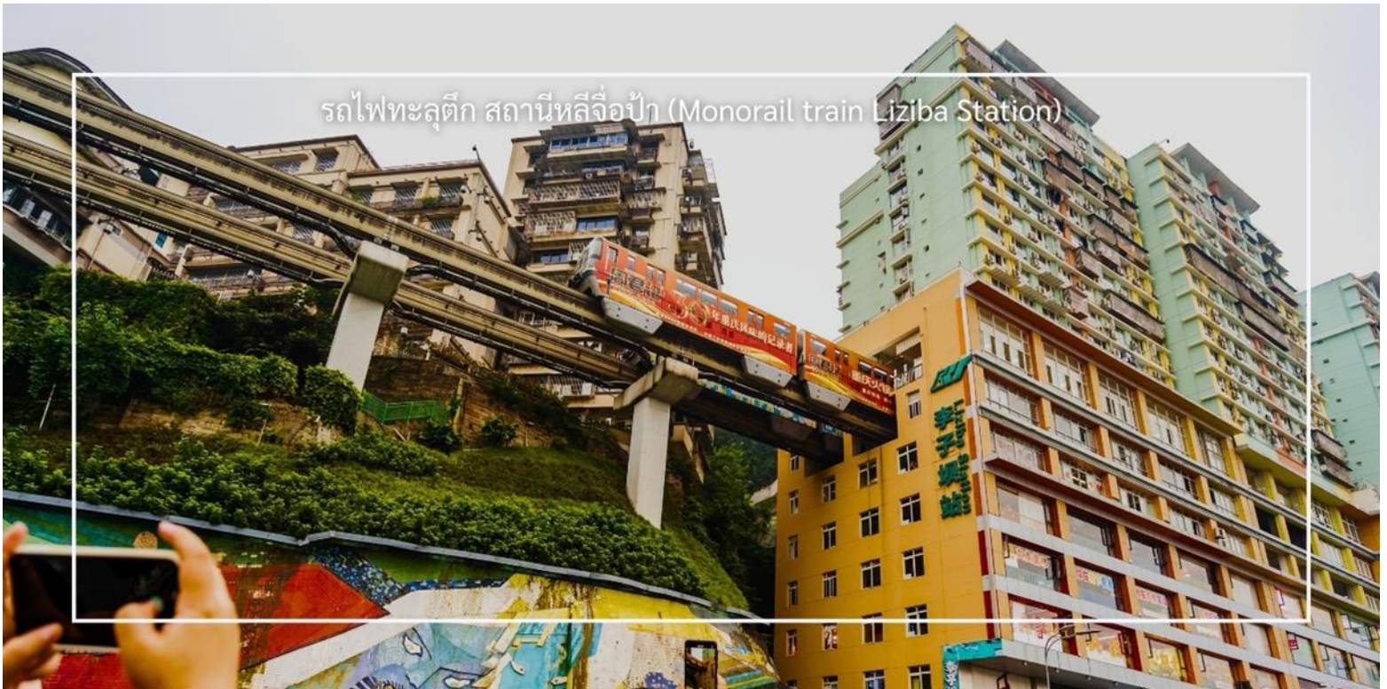
รถไฟทะลุทิก สถานีหลี่จื่อป้า (Monorail train Liziba Station)

จากนั้นนำท่าน นั่งรถไฟทะลุтик (Monorail Train) หนึ่งในประสบการณ์ที่น่าสนใจและเป็นเอกลักษณ์ในเมืองฉงชิ่ง รถไฟเส้นนี้มีเส้นทางที่ผ่านอาคารและที่อยู่อาศัย ทำให้ผู้โดยสารรู้สึกเหมือนกำลังนั่งรถไฟที่ทะลุผ่านตึกสูง เส้นทางที่น่าสนใจในรถไฟนี้รวมถึงสถานีที่มีชื่อเสียง เช่น สถานีหลี่จื่อป้า (Liziba Station) ซึ่งตั้งอยู่ในพื้นที่ที่มีความหนาแน่นของประชากร การนั่งรถไฟทะลุทิกนี้เป็นวนิธีที่ยอดเยี่ยมในการสัมผัสกับวัฒนธรรมเมืองฉงชิ่งและชื่นชมกับการพัฒนาเมืองที่น่าทึ่ง หากคุณมีโอกาไปเยือนฉงชิ่ง อย่าลืมลองนั่งรถไฟเส้นนี้เพื่อสัมผัสประสบการณ์ที่ไม่เหมือนใคร