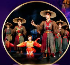
แสง สี เสียง ตระการตา