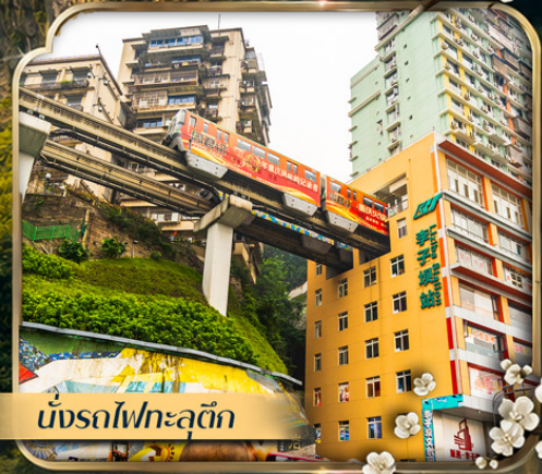
นั่งรถไฟกะลุดัก

คอนเฟิร์มออกเดินทาง ตั้งแต่ 10 ท่าน ขึ้นไป