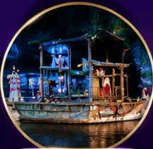
บทการแสดง เข้มข้น น่าประทับใจ