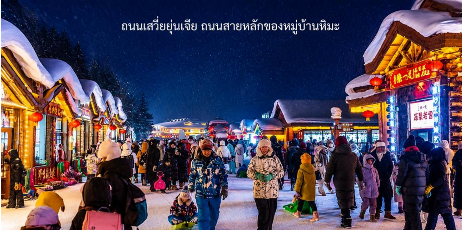
ถนนเสวี่ยยุ่นเจีย ถนนสายหลักของหมู่บ้านหิมะ

นำท่านเดินชมบรรยากาศบน ถนนเสวี่ยยุ่นเจีย ถนนสายหลักของหมู่บ้านหิมะ ที่ได้เต็มไปด้วยร้านค้าของที่ระลึก ร้านอาหารท้องถิ่น และร้านกาแฟน่ารัก ๆ ถนนสายนี้ถูกตกแต่งด้วยไฟประดับและโคมแดงสไตล์จีน เพิ่มเสน่ห์ให้บรรยากาศอบอุ่น และมีชีวิตชีวาที่ท่านสามารถช้อปปิ้งสินค้าท้องถิ่น หรือสินค้าแฮนด์เมด พร้อมถ่ายภาพเก็บความทรงจำในมุมสวย ๆ ของหมู่บ้าน ได้ตลอดทั้งคืน