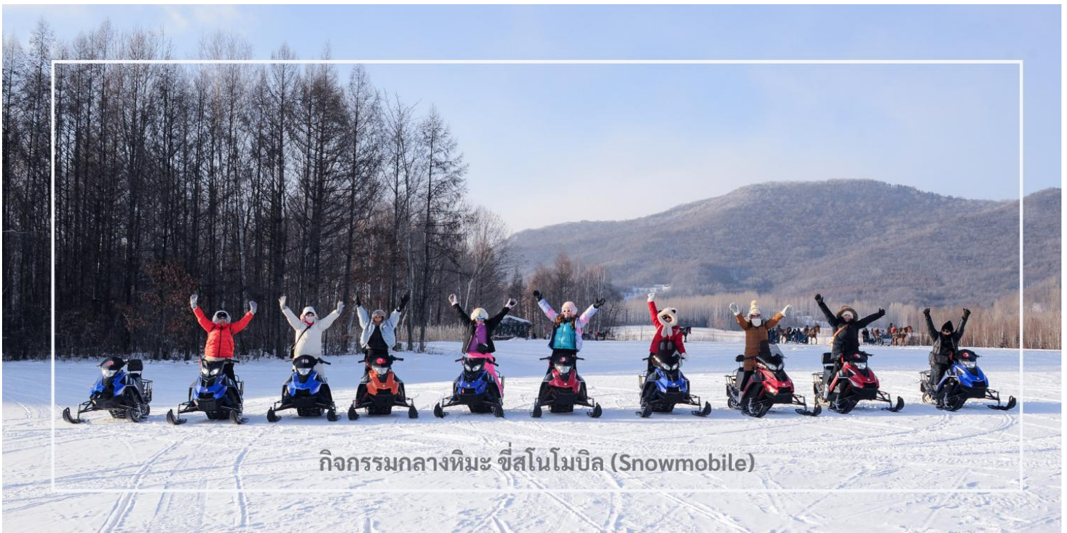
กิจกรรมกลางหิมะ ซีสนโนโมบิล (Snowmobile)

สมควรแก่เวลานำท่านเดินทางสู่เมือง มู่ตันเจียง (Mudanjiang) ใช้เวลาเดินทางประมาณ 2 ชั่วโมง มู่ตันเจียง เมืองสำคัญตั้งอยู่ใกล้พรมแดนรัสเซีย ห่างไปทางตะวันตกประมาณ 110 กิโลเมตร เมืองนี้มีเอกลักษณ์วัฒนธรรม และสถาปัตยกรรมที่ผสมผสานระหว่างรัสเซียและจีน โดยเฉพาะในฤดูหนาวเมืองจะถูกปกคลุมด้วยหิมะขาวโพลน