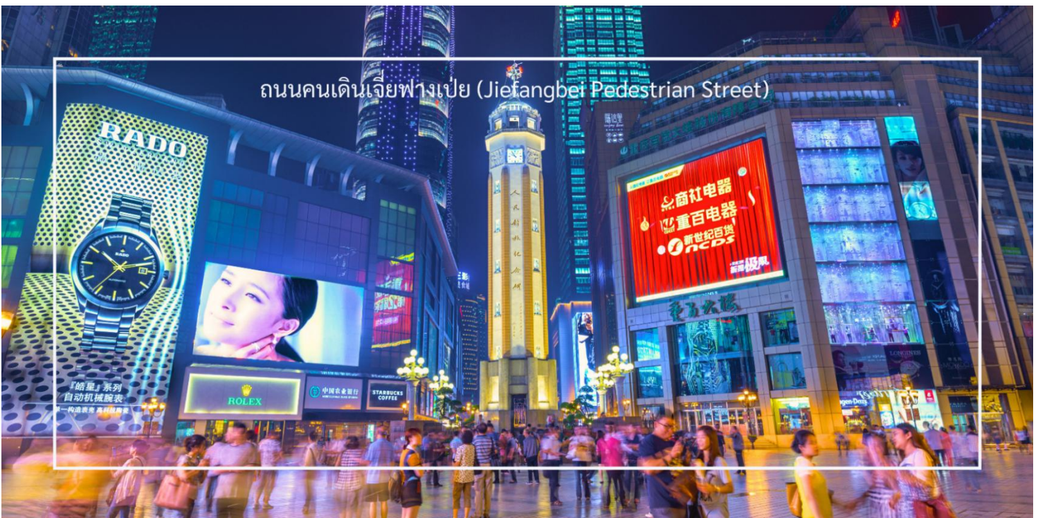
ถนนคนเดินเจี๋ยฟางเป่ย์ (Jiefangbei Pedestrian Street)

สมควรแก่เวลา นำท่านสู่ ถนนคนเดินเจี๋ยฟางเป่ย์ (Jiefangbei Pedestrian Street) เป็นหนึ่งในแหล่งช้อปปิ้งและท่องเที่ยวที่สำคัญที่สุดในเมืองฉงชิ่ง (Chongqing) เป็นพื้นที่ที่มีชีวิตชีวาและคึกคัก มีร้านค้า ร้านอาหาร และสถานบันเทิงมากมาย ถนนนี้ตั้งอยู่ใกล้กับสถานที่ท่องเที่ยวสำคัญอื่นๆ เช่น มหาศาลาประชาชนแห่งเมืองฉงชิ่ง ทำให้สามารถเดินเที่ยวชมได้อย่างสะดวก ถนนสายนี้มีบรรยากาศที่มีชีวิตชีวา โดยเฉพาะในช่วงเย็นที่มีแสงไฟและการแสดงต่างๆ ที่ทำให้บรรยากาศน่าสนใจยิ่งขึ้น และยังเต็มไปด้วยร้านค้าแบรนด์เนม ร้านค้าท้องถิ่น และตลาดที่ขายสินค้าต่างๆ เช่น เสื้อผ้า เครื่องประดับ