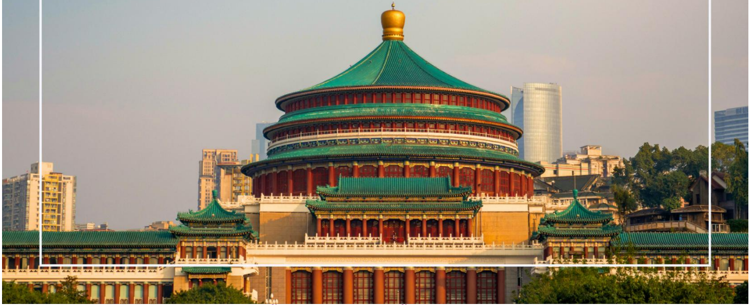
มหาศาลาประชาชนแห่งเมืองฉงชิ่ง (Chongqing People's Grand Hall)