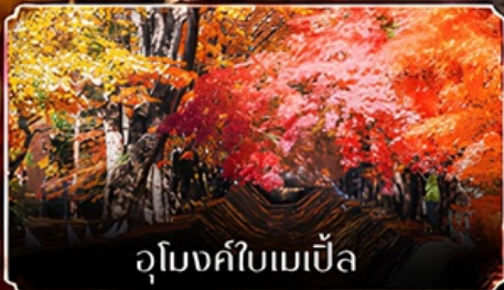
อุโมงค์ใบเมเปิ้ล