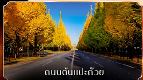
ถนนต้นแปะก๊วย