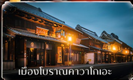
เมืองโบราณคาวาโกเอะ