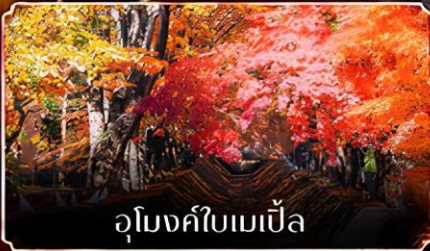
อุโมงค์ใบเมเปิ้ล