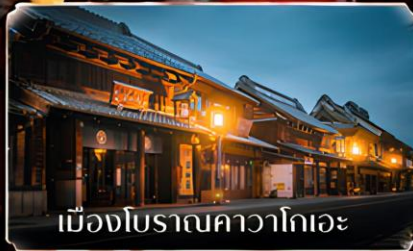
เมืองโบราณคาวาโกเอะ