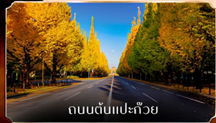
ถนนต้นแปะก๊วย