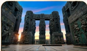
อนุสรณ์ประวัติศาสตร์จอร์เจีย