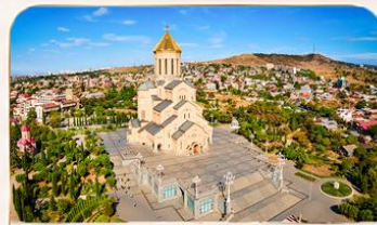
โบสถ์กรินิตี