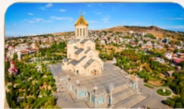
โบสถ์กรินิตี