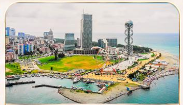
เมืองชายทะเล บาดูมี