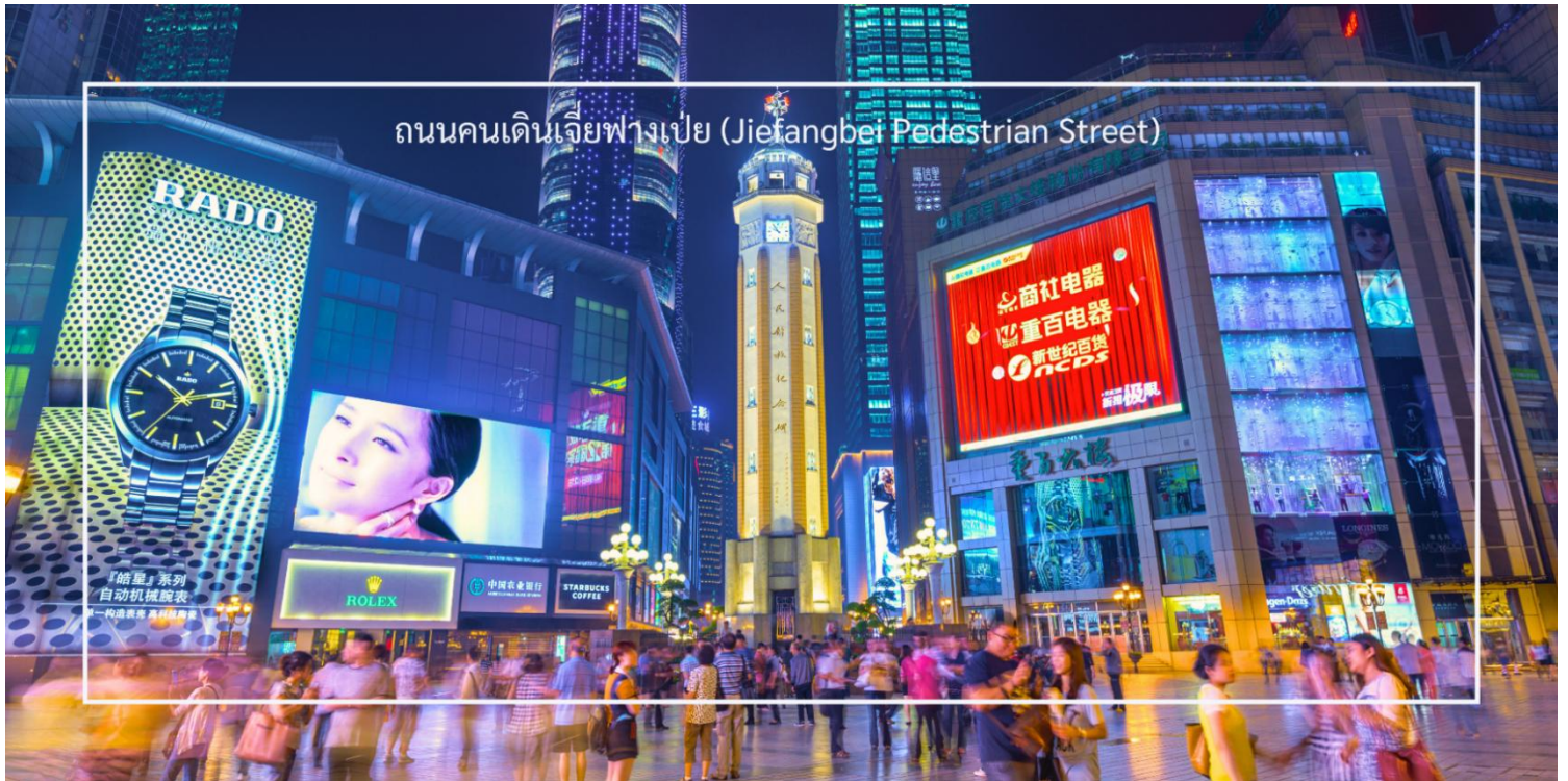
ถนนคนเดินเจี๋ยฟางเป่ย์ (Jiefangbei Pedestrian Street)