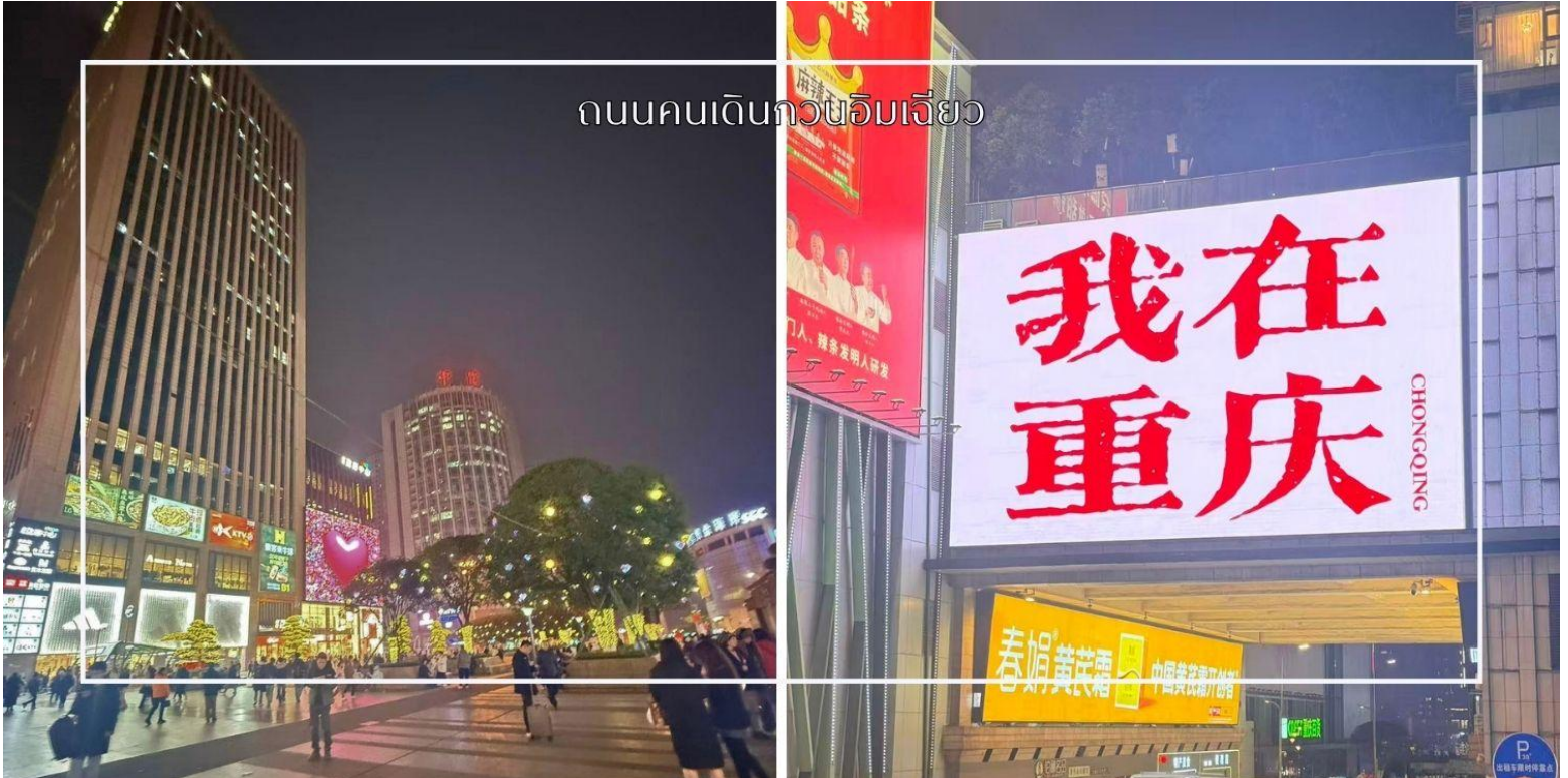
ถนนคนเดินกวนอิมเฉียว

นำท่านสู่ ถนนคนเดินกวนอิมเฉียว ย่านช้อปปิ้งและไลฟ์สไตล์ชื่อดังใจกลางเมืองฉงชิ่ง ตั้งอยู่ในเขตเจียงเป่ย์ เป็นแหล่งรวมความทันสมัยที่คึกคักตลอด 24 ชั่วโมง ภายในพื้นที่เต็มไปด้วยห้างสรรพสินค้า ร้านค้าแบรนด์ชั้นนำ ร้านอาหารท้องถิ่นและนานาชาติ รวมถึงคาเฟ่และแหล่งบันเทิงมากมาย เหมาะสำหรับการเดินเล่น ช้อปปิ้ง และสัมผัสบรรยากาศเมืองใหญ่ของฉงชิ่งอย่างแท้จริง อีกหนึ่งไฮไลท์สำคัญคือจุดถ่ายภาพยอดนิยม ป้ายไฟ 我在重庆 (I am in Chongqing) ซึ่งถือเป็นแลนด์มาร์กเช็คอินที่นักท่องเที่ยวไม่ควรพลาด