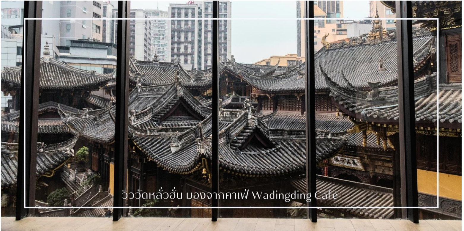
วิววัดหลว๋ออัน มองจากคาเฟ่ Wadingding Cafe