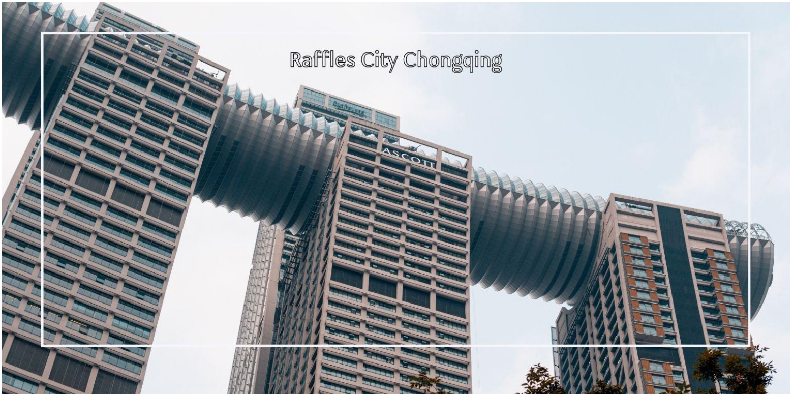
Raffles City Chongqing

นำท่านช้อปปิ้ง Raffles City Chongqing ภายในโครงการเป็นศูนย์การค้าขนาดใหญ่ที่ทันสมัย ครบครันด้วยร้านค้าแบรนด์นานาชาติ ร้านท้องถิ่น ร้านอาหาร และคาเฟ่หลากหลายรูปแบบ พื้นที่กว้างขวางให้บรรยากาศหรูหรา