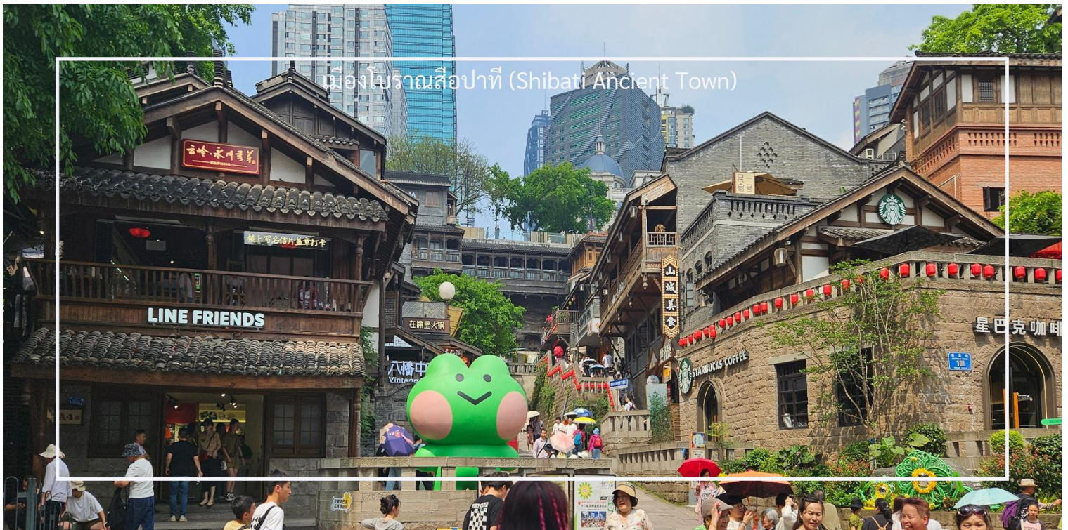
เมืองโบราณสี่ปาตี (Shibati Ancient Town)

นำท่านเที่ยวชม เมืองโบราณสี่ปาตี (Shibati Ancient Town) ตั้งอยู่ในเขตฉงชิ่ง (Chongqing) เป็นเมืองโบราณที่มีเสน่ห์และเต็มไปด้วยประวัติศาสตร์ อดีตของเมืองนี้ย้อนกลับไปหลายร้อยปี และมีการอนุรักษ์สถาปัตยกรรมแบบดั้งเดิมไว้เป็นอย่างดี เมืองนี้มีบ้านเรือนและอาคารที่สร้างขึ้นในสไตล์จีนโบราณ ซึ่งมีลักษณะเฉพาะที่สะท้อนถึงวัฒนธรรมและประเพณีท้องถิ่น และยังมี ถนนในเมืองโบราณสี่ปาตีที่มีความคดเคี้ยวและเต็มไปด้วยร้านค้า ร้านอาหาร และคาเฟ่ที่ขายสินค้าท้องถิ่น