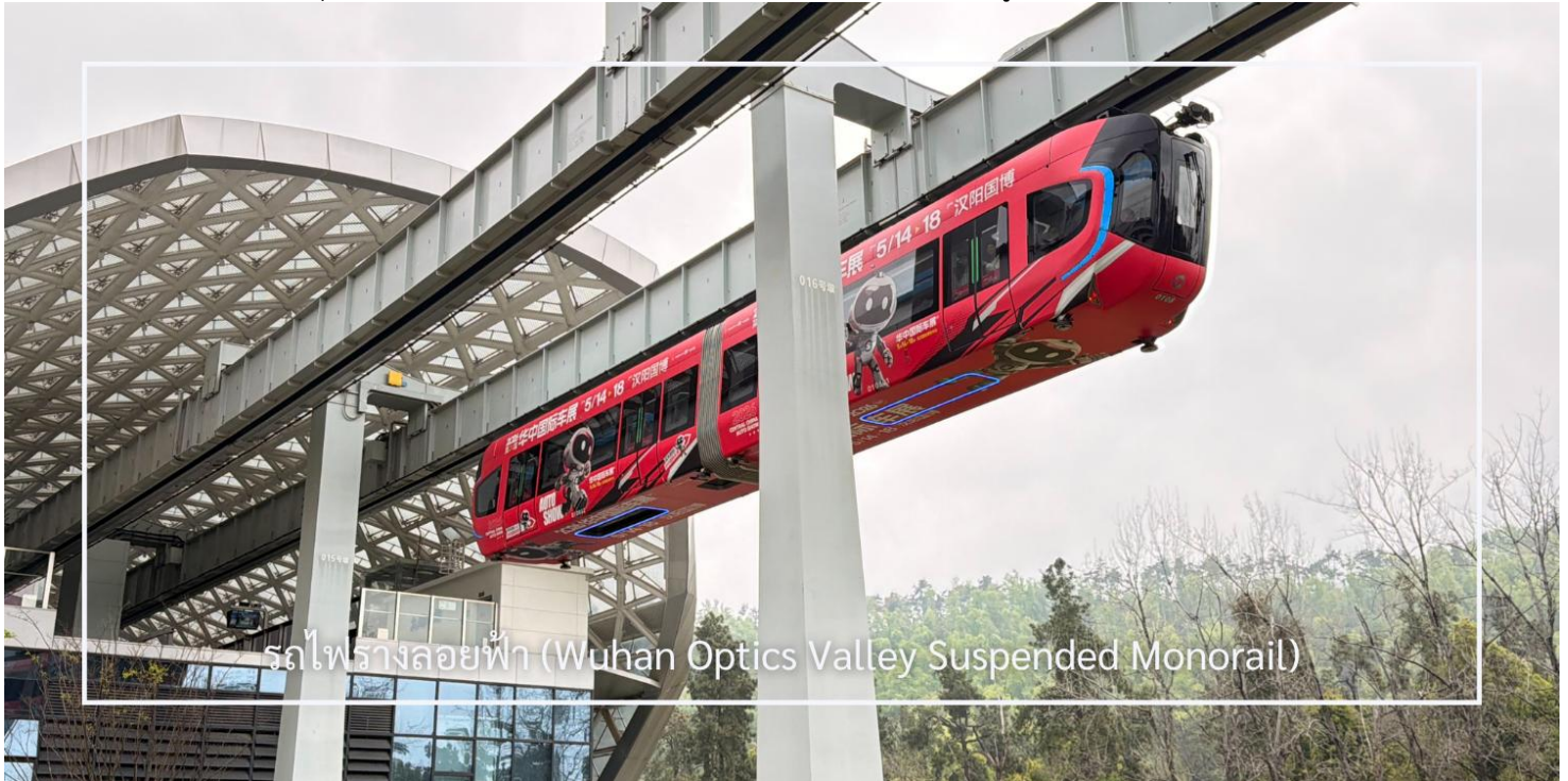
รถไฟรางลอยฟ้า (Wuhan Optics Valley Suspended Monorail)

นำท่านนั่ง รถไฟรางแขวนลอยฟ้า อีกหนึ่งประสบการณ์แปลกใหม่ของเมืองอู่ฮั่นภายในมีพื้นที่กระจก สามารถมองเห็นด้านล่างได้ชัดเจน ให้ความรู้สึกเหมือนลอยอยู่เหนือเมือง เพิ่มความตื่นเต้นตลอดเส้นทางระหว่างทางสามารถชมวิวสองข้างทางในมุมที่แตกต่าง พร้อมเก็บภาพความประทับใจกับการเดินทางรูปแบบพิเศษที่ไม่เหมือนใคร