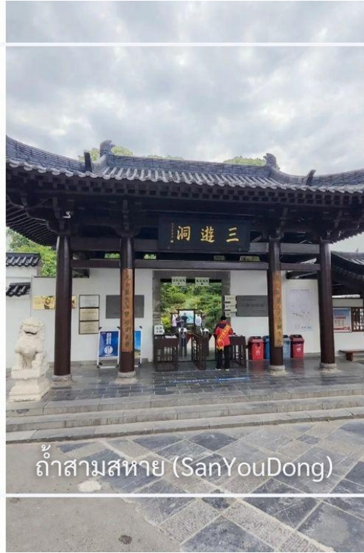
ถ้ำสามสหาย (SanYouDong)