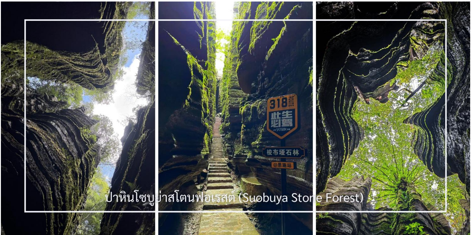
ป่าหินโซบูย่าสโตนฟอเรสต์ (Suobuya Stone Forest)

หลังอาหารเช้านำท่านสู่ ป่าหินโซบูย่าสโตนฟอเรสต์ (Suobuya Stone Forest) แหล่งท่องเที่ยวทางธรรมชาติอันน่ามหัศจรรย์ ซึ่งโดดเด่นด้วยกลุ่มหินปูนรูปร่างแปลกตาที่ก่อตัวขึ้นตามธรรมชาติเป็นเวลานานนับล้านปี ภายในพื้นที่เต็มไปด้วยเสาหินสูงตระหง่านเรียงรายสลับซับซ้อน เปรียบเสมือนป่าที่สร้างขึ้นจากหิน ผสานกับบรรยากาศร่มรื่นและเงียบสงบ เหมาะแก่การเดินชมธรรมชาติและเก็บภาพความประทับใจตลอดเส้นทาง