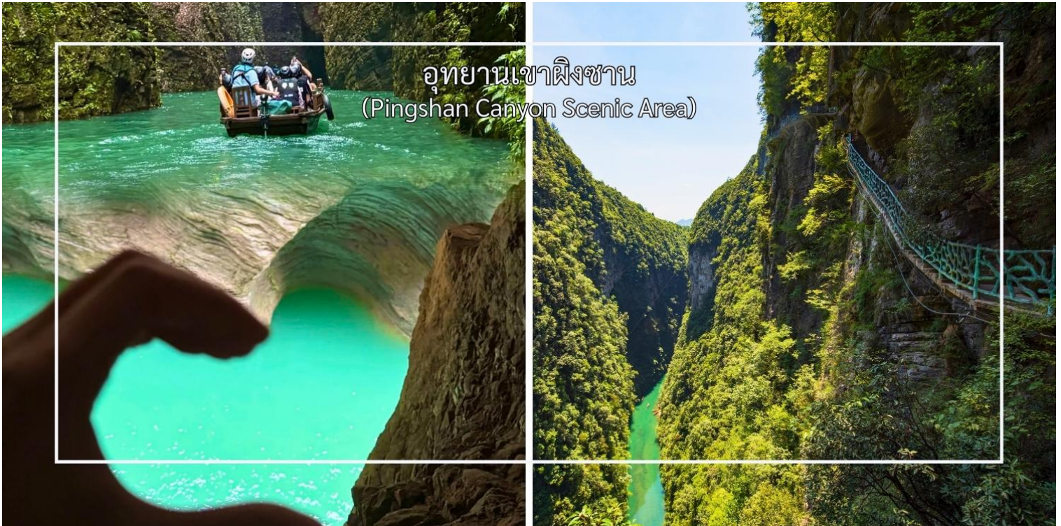
อุทยานเขาผิงซาน (Pingshan Canyon Scenic Area)

นำท่านสัมผัสความยิ่งใหญ่ที่เทียบระดับ 4A ที่ อุทยานเขาผิงซาน(Pingshan Canyon Scenic Area) หรือที่นักท่องเที่ยวรู้จักในชื่อ โกรกรูปหัวใจ (Heart-Shaped Gorge) เป็นหนึ่งในแลนด์มาร์กธรรมชาติที่สวยงามและมีเอกลักษณ์สวยงามด้วยรูปทรงโกรกที่คล้ายหัวใจซึ่งเกิดจากการกัดเซาะของสายน้ำและกระบวนการทางธรณีวิทยามายาวนาน ทำให้กลายเป็นจุดชมวิวที่โรแมนติกและเหมาะแก่การถ่ายภาพ ท่านสามารถเดินชมเส้นทางธรรมชาติรอบโกรก หรือมองจากจุดชมวิวสูงเพื่อเห็นภาพโกรกรูปหัวใจอย่างเต็มตา นอกจากความสวยงามแล้ว บริเวณนี้ยังเต็มไปด้วยธรรมชาติอันอุดมสมบูรณ์ ทั้งป่าไม้ ลำธาร และสัตว์ป่าที่อาศัยอยู่ในพื้นที่ ทำให้เป็นจุดหมายที่ผสมผสานทั้งความงดงามและความสงบแห่งธรรมชาติ (รวมล่องเรือ)