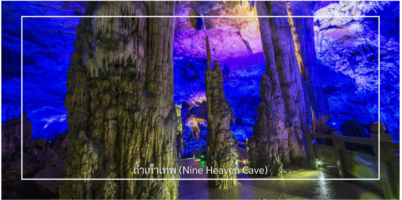
ถ้ำเก้าเทพ (Nine Heaven Cave)