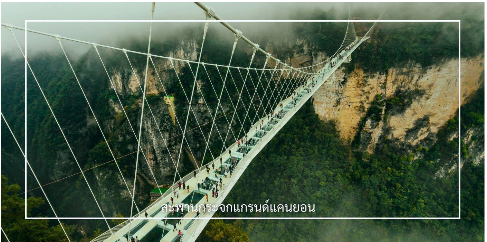
สะพานกระจกแกรนด์แคนยอน

ท่านสามารถเลือกซื้อบริการเสริม (Option) เพิ่มเติมได้: สะพานกระจกแกรนด์แคนยอน 400 หยวน/ท่าน สัมผัสประสบการณ์สุดตื่นเต้นกับการเดินบนสะพานกระจกใส ที่ทอดยาวเหนือหุบเขาสูง ให้ท่านได้ชมทัศนียภาพอันงดงาม แบบพาโนรามา พร้อมท้าทายความกล้าท่ามกลางบรรยากาศธรรมชาติอันยิ่งใหญ่