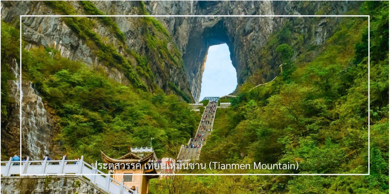
ประตูสวรรค์ เทียนเหมินซาน (Tianmen Mountain)

เสียดฟ้า เมื่อถึงยอดเขาเทียนเหมินซาน นำคณะเดินตามเส้นทางชมวิวเลียบบภูเขาและหน้าผา ชมทัศนียภาพจากมุมสูงบนยอดเขา ทำท่ายความกล้าของท่านด้วยการเดินบนพื้นกระจกใสของ ระเบียงแก้ว กระจกใสเลียบบหน้าผา จากนั้นนำท่านสู่ ประตูสวรรค์ โดย บันไดเลื่อนที่สร้างขึ้นโดยการเจาะทะลุภูเขาที่เรียงติดต่อกันถึง 5 ตอน เป็นเครื่องอำนวยความสะดวกใหม่ล่าสุดของ เขาเทียนเหมินซาน ท่านจะได้ถ่ายภาพ ประตูสวรรค์ อย่างใกล้ชิด