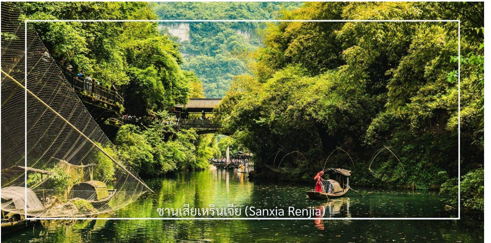
ซานเซียเหรินเจีย (Sanxia Renjia)

วันที่สอง หมู่บ้านซานเซียเหรินเจีย(รวมล่องเรือ+ชมการแสดง)-บ้านเกิดกวีซีเหวียน(รวมรถแบตเตอรี่)-ถนนคนเดิน CBD B/L/D เช้า บริการอาหารเช้า ณ โรงแรมที่พัก (มือที่1)