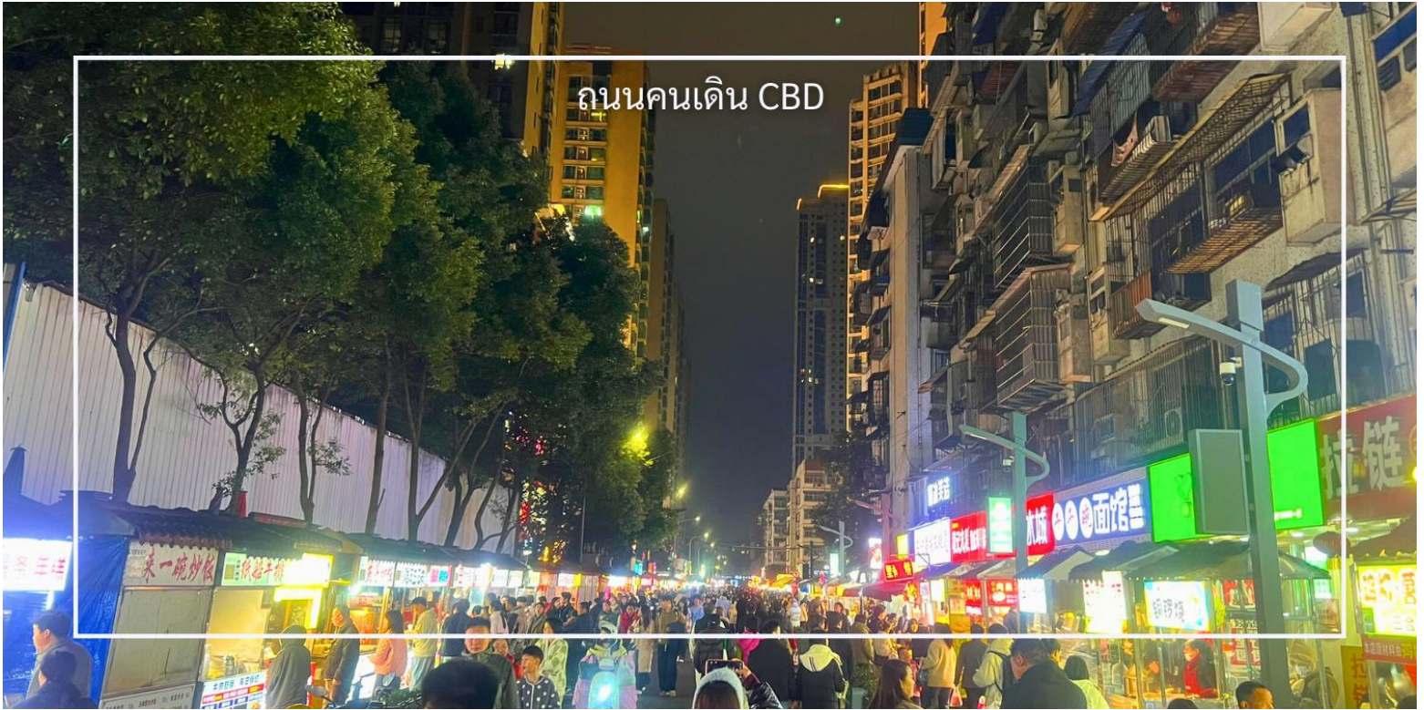
ถนนคนเดิน CBD