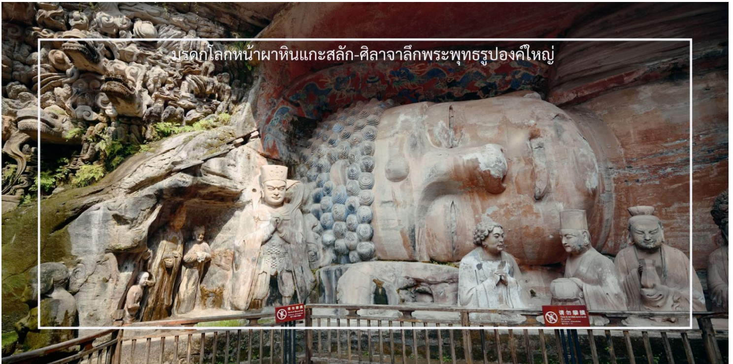
มรดกโลกหน้าผาทินแกะสลัก-ศิลาจารึกพระพุทธรูปองค์ใหญ่