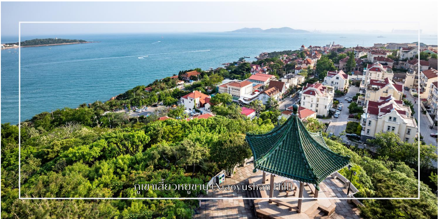
ภูเขาเสี่ยวหยูซาน (Xiaoyushan Hill)

จากนั้นนำท่านเดินเล่น ถ่ายภาพ ถนนหลงเจียง (Longjiang Road) หรือ มักเรียกว่า "ถนนการ์ตูน" หรือ "ถนนอนิเมะ" ที่นี่ถือเป็นสตูดิโอถ่ายรูปรูปที่เหล่าสาวกอนิเมะหลงไหล (สตรีทอาร์ทสตูดิโอจิปี) ย่านเล็กๆ ที่ซ่อนตัวอยู่ท่ามกลางสถาปัตยกรรมยุโรปอันมีเสน่ห์ เต็มไปด้วยตรอกซอกซอยและมุมถ่ายภาพที่ให้บรรยากาศราวกับหลุดออกมาจากโลกแห่งจินตนาการของ สตูดิโอจิปี ผสานความคลาสสิกของอาคารเก่าเข้ากับสีส้มและลวดลายการ์ตูนได้อย่างกลมกลืน เป็นอีกหนึ่งจุดเช็คอินสุดน่ารักที่เหมาะสมสำหรับการเดินเล่น ถ่ายภาพ และเก็บความประทับใจแปลกใหม่ของเมืองชิงเต่า นำท่านแวะเช็คอิน สะพานจ้านเจียว (Zhanqiao Pier) แลนด์มาร์กสำคัญและสัญลักษณ์ของเมืองชิงเต่า สะพานแห่งนี้ทอดยาวสู่ทะเลจากชายฝั่งใจกลางเมือง สร้างขึ้นตั้งแต่สมัยราชวงศ์ชิง มีความยาวประมาณ 440 เมตร เป็นจุดชมวิวยอดนิยม ท่านสามารถเพลิดเพลินกับบรรยากาศชายทะเล และวิวอ่าวชิงเต่าอันกว้างไกล อีกทั้งยังเป็นจุดถ่ายภาพยอดนิยมที่มองเห็นภาพเมืองชิงเต่าตัดกับท้องฟ้าและผิวน้ำสีฟ้าได้อย่างสวยงาม