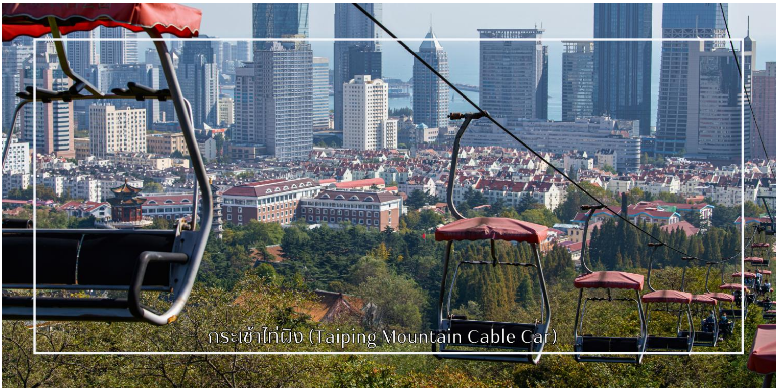
กระเช้าไท่ผิง (Taiping Mountain Cable Car)

นำท่านสู่ กระเช้าไท่ผิง (Taiping Mountain Cable Car) (รวมค่ากระเช้า) หนึ่งในกิจกรรมท่องเที่ยวยอดนิยมของเมืองชิงเต่า ตั้งอยู่บริเวณภูเขาไท่ผิง ซึ่งเป็นจุดชมวิวสำคัญของเมือง นำท่านโดยสารกระเช้าลอยฟ้าขึ้นสู่จุดชมวิวด้านบนเพื่อสัมผัสทัศนียภาพอันงดงามของตัวเมืองชิงเต่า ทะเลสีคราม และแนวชายฝั่งที่ทอดยาวอย่างตระการตา ระหว่างการโดยสารกระเช้า ท่านจะได้ชมวิวมุมสูงของผืนป่า อาคารบ้านเรือนสไตล์ยุโรป และภูมิประเทศที่ผสมผสานระหว่างภูเขากับทะเลอย่างลงตัว บรรยากาศเงียบสงบและอากาศบริสุทธิ์ ทำให้เป็นประสบการณ์ที่ทั้งผ่อนคลายและน่าประทับใจ