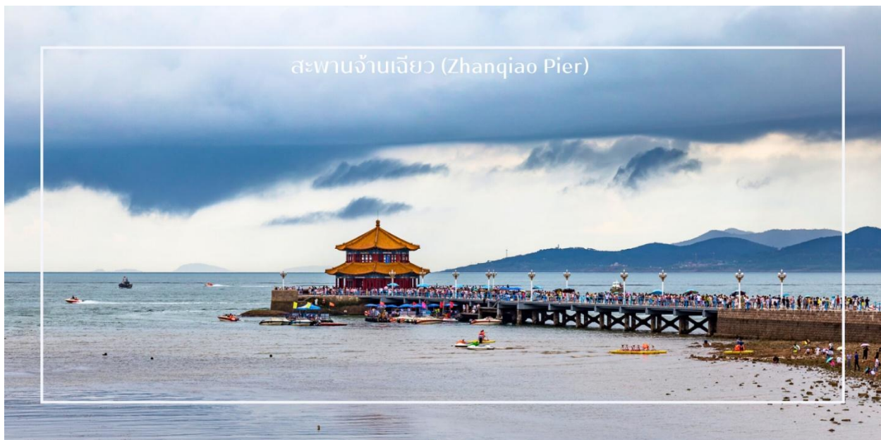
สะพานจ้านเจียว (Zhanqiao Pier)

จากนั้นนำท่านเดินเล่น ถ่ายภาพ ถนนหลงเจียง (Longjiang Road) หรือ มักเรียกว่า "ถนนการ์ตูน" หรือ "ถนนอนิเมะ" ที่นี่ถือเป็นสตูดิโอถ่ายรูปรูปที่เหล่าสาวกอนิเมะหลงไหล (สตรีทอาร์ทสตูดิโอจิปี) ย่านเล็กๆ ที่ซ่อนตัวอยู่ท่ามกลางสถาปัตยกรรมยุโรปอันมีเสน่ห์ เต็มไปด้วยตรอกซอกซอยและมุมถ่ายภาพที่ให้บรรยากาศราวกับหลุดออกมาจากโลกแห่งจินตนาการของ สตูดิโอจิปี ผสานความคลาสสิกของอาคารเก่าเข้ากับสีส้มและลวดลายการ์ตูนได้อย่างกลมกลืน เป็นอีกหนึ่งจุดเช็คอินสุดน่ารักที่เหมาะสมสำหรับการเดินเล่น ถ่ายภาพ และเก็บความประทับใจแปลกใหม่ของเมืองชิงเต่า นำท่านแวะเช็คอิน สะพานจ้านเจียว (Zhanqiao Pier) แลนด์มาร์กสำคัญและสัญลักษณ์ของเมืองชิงเต่า สะพานแห่งนี้ทอดยาวสู่ทะเลจากชายฝั่งใจกลางเมือง สร้างขึ้นตั้งแต่สมัยราชวงศ์ชิง มีความยาวประมาณ 440 เมตร เป็นจุดชมวิวยอดนิยม ท่านสามารถเพลิดเพลินกับบรรยากาศชายทะเล และวิวอ่าวชิงเต่าอันกว้างไกล อีกทั้งยังเป็นจุดถ่ายภาพยอดนิยมที่มองเห็นภาพเมืองชิงเต่าตัดกับท้องฟ้าและผิวน้ำสีฟ้าได้อย่างสวยงาม