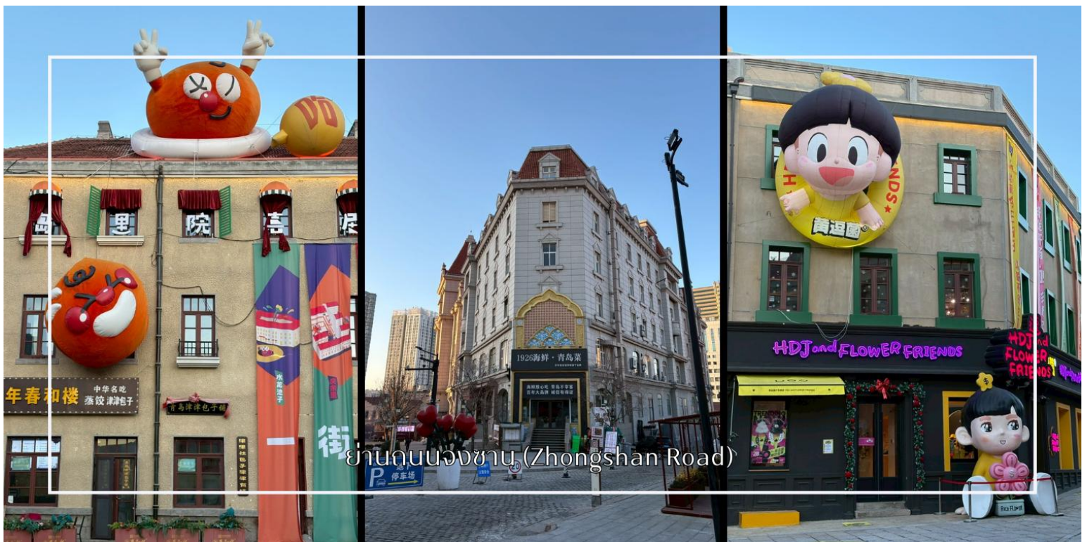
ย่านถนนจงซาน (Zhongshan Road)

นำท่านเดินชมบรรยากาศบน ถนนจงซาน (Zhongshan Road) ถนนสายเก่าแก่ใจกลางเมืองชิงเต่า ที่เต็มไปด้วยเสน่ห์ของอาคารสไตล์ยุโรปยุคอาณานิคมและกลิ่นอายเมืองท่าริมทะเลอันคึกคัก ถนนสายนี้ถือเป็นย่านการค้าสำคัญในอดีต ปัจจุบันเต็มไปด้วยร้านค้า ร้านอาหาร คาเฟ่ และร้านของฝากท้องถิ่นให้เลือกซื้ออย่างเพลิดเพลิน