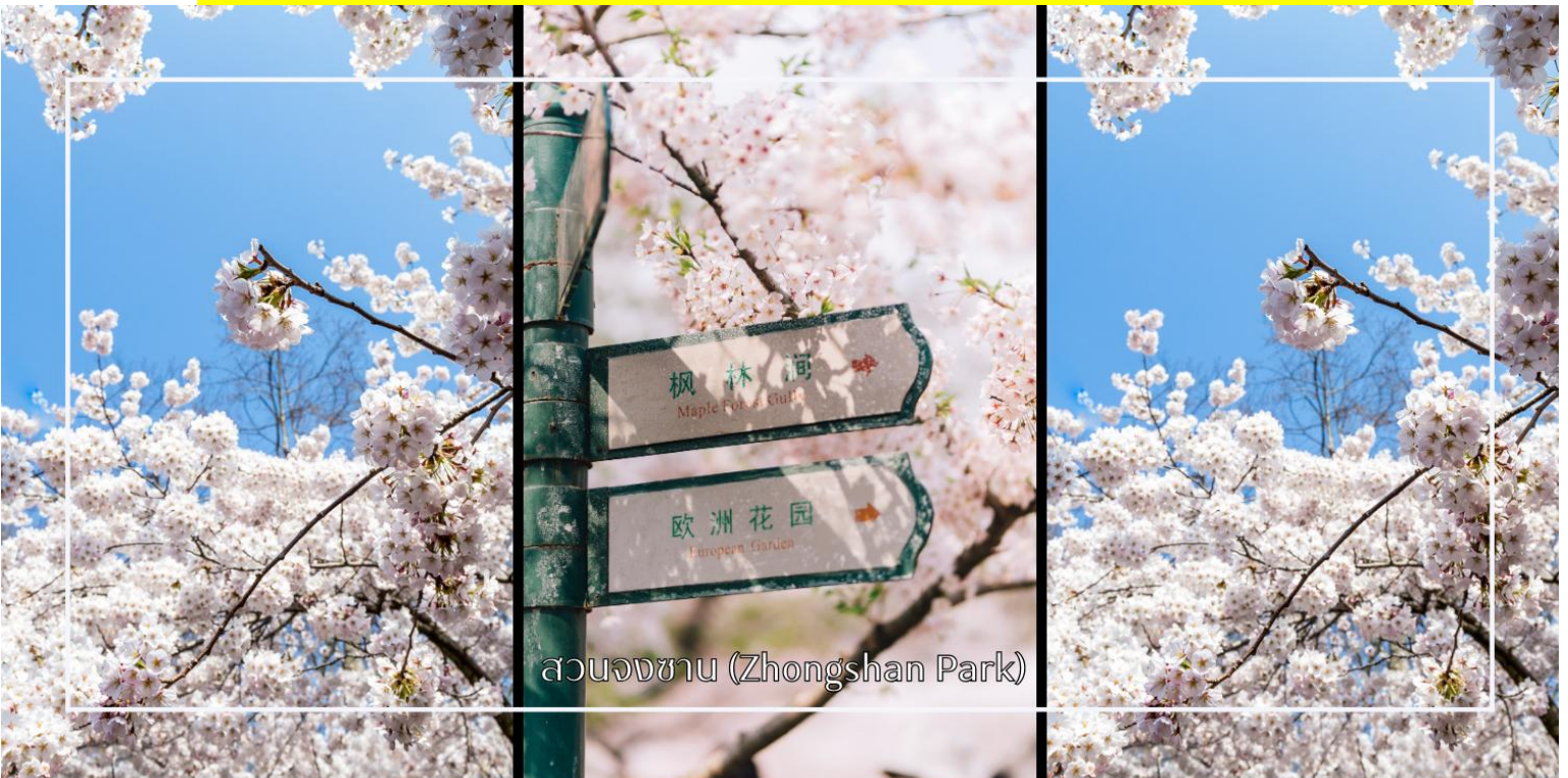
สวนจงซาน (Zhongshan Park)

หมายเหตุ: การบานของดอกซากุระขึ้นอยู่กับสภาพอากาศในแต่ละปีเป็นสำคัญ ทางบริษัทฯ ไม่สามารถรับประกันได้ว่าในช่วงวันเดินทางดอกซากุระจะบานมากหรือน้อย ทั้งนี้ขึ้นอยู่กับสภาพอากาศและธรรมชาติ ณ ช่วงเวลานั้น