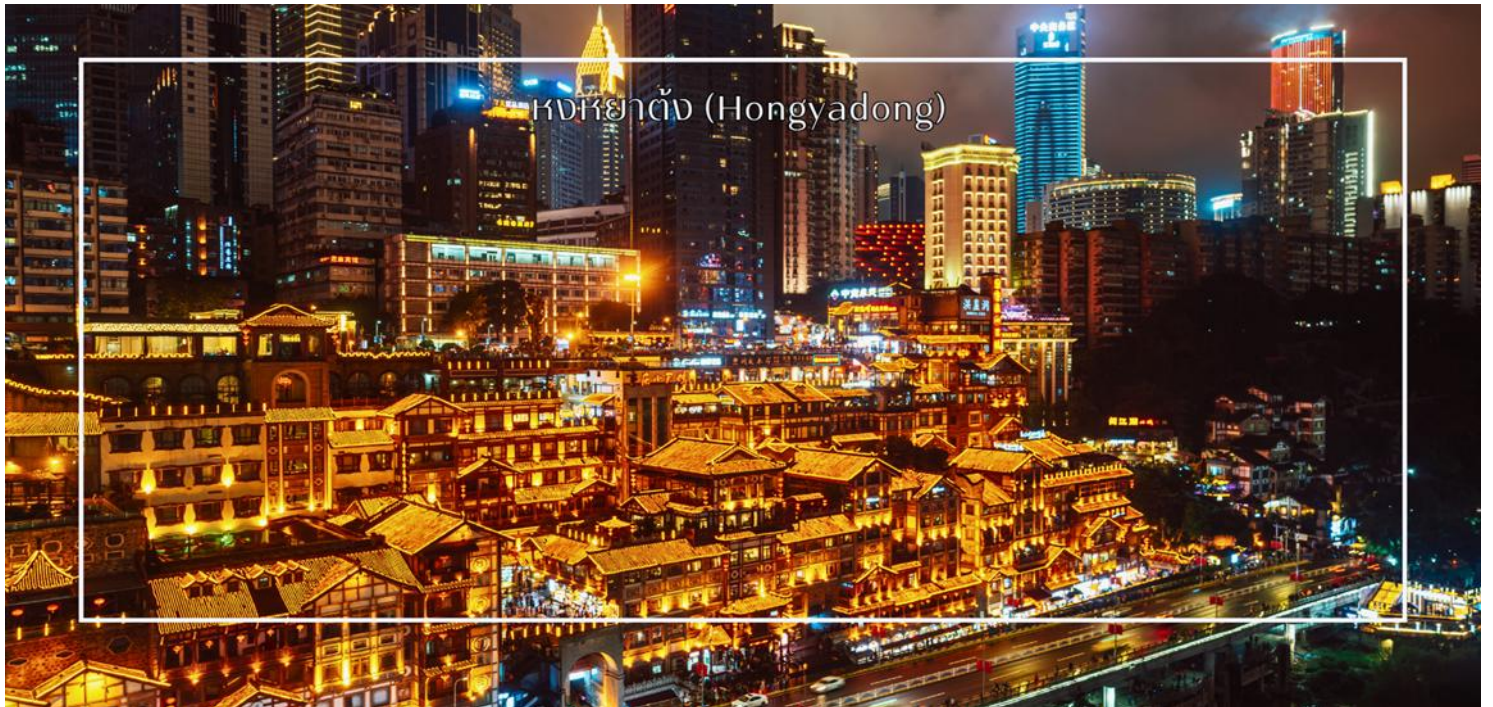
หงหยาดัง (Hongyadong)

สมควรแก่เวลา นำท่านเดินทางสู่ ตลาดหงหยาดัง (Hongyadong) หรือที่เรียกว่า "Hongya Cave" เป็นสถานที่ท่องเที่ยวที่มีชื่อเสียงในเมืองฉงชิ่ง โดยตั้งอยู่ริมแม่น้ำแยงซี มีบรรยากาศที่เต็มไปด้วยวัฒนธรรมและประวัติศาสตร์ ตลาดหงหยาดังเป็นพื้นที่ที่มีอาคารแบบดั้งเดิมที่สร้างขึ้นในสไตล์สถาปัตยกรรมแบบชิโน-ทิเบต โดยมีร้านค้า ร้านอาหาร และบาร์จำนวนมาก ที่นี้ท่านสามารถลิ้มลองอาหารรสเด็ดและชมพื้นเมืองอื่นๆที่ขึ้นชื่อ ตลาดหงหยาดังยังมีวิวทิวทัศน์ที่สวยงาม สามารถเดินเล่นตามทางเดินที่มีการจัดแสดงงานศิลปะและสินค้าท้องถิ่น