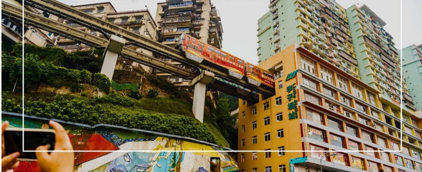
รถไฟทะลุตึก สถานีหลี่จื่อป้า (Monorail train Liziba Station)

นำท่าน นั่งรถไฟทะลุตึก (Monorail train Liziba Station) เป็นหนึ่งในประสบการณ์ที่น่าสนใจและเป็นเอกลักษณ์ในเมืองฉงชิ่ง รถไฟเส้นนี้มีเส้นทางที่ผ่านอาคารและที่อยู่อาศัย ทำให้ผู้โดยสารรู้สึกเหมือนกำลังนั่งรถไฟที่ทะลุผ่านตึกสูง เส้นทางที่น่าสนใจในรถไฟนี้รวมถึงสถานีที่มีชื่อเสียง เช่น สถานีหลี่จื่อป้า (Liziba Station) ซึ่งตั้งอยู่ในพื้นที่ที่มีความหนาแน่นของประชากร การนั่งรถไฟทะลุตึกนี้เป็นวิธีที่ยอดเยี่ยมในการสัมผัสกับวัฒนธรรมเมืองฉงชิ่งและชื่นชมกับการพัฒนาเมืองที่น่าทึ่ง หากคุณมีโอกาสนั่งรถไฟสายนี้เพื่อสัมผัสประสบการณ์ที่ไม่เหมือนใคร