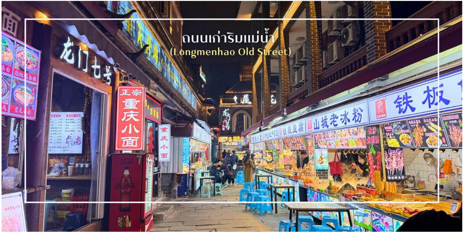
ถนนเก่าริมแม่น้ำ (Longmenhao Old Street)

เย็น บริการอาหารเย็น ณ ภัตตาคาร (มื้อที่ 9) เมนูพิเศษ : สุกี้หม่าล่า