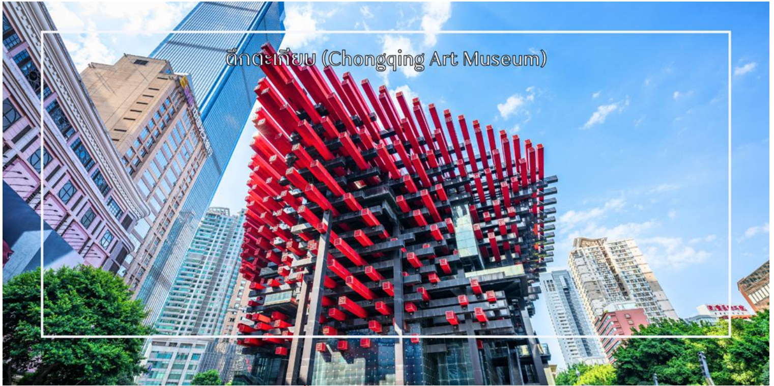
ตึกตะเกียบ (Chongqing Art Museum)