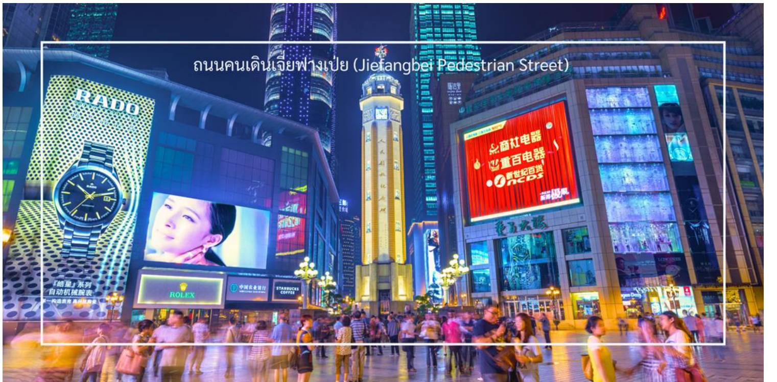
ถนนคนเดินเจี๋ยฟางเป่ย์ (Jiefangbei Pedestrian Street)

ได้เวลาอันสมควร นำท่านเดินทางสู่สนามบินฉงชิ่ง เพื่อเดินทางกลับ