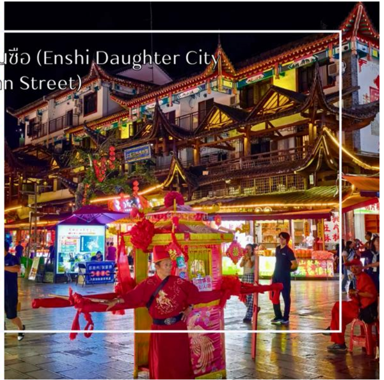
ถนนคนเดินเมืองลูกสาวเินซือ (Enshi Daughter City Pedestrian Street)

เย็น บริการอาหารเย็น ณ ภัตตาคาร (มื้อที่ 6)