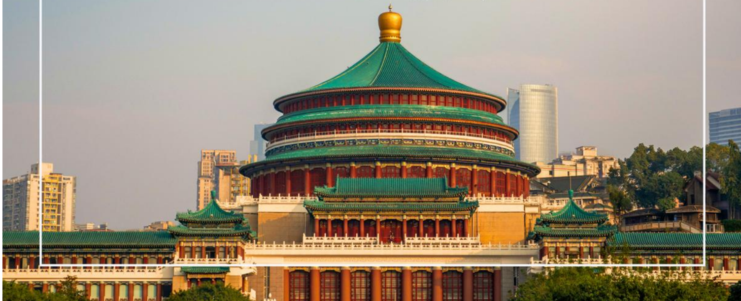
มหาศาลาประชาชนแห่งเมืองฉงชิ่ง (Chongqing People's Grand Hall)

นำท่าน นั่งรถไฟทะลุตึก (Monorail train Liziba Station) เป็นหนึ่งในประสบการณ์ที่น่าสนใจและเป็นเอกลักษณ์ในเมืองฉงชิ่ง รถไฟเส้นนี้มีเส้นทางที่ผ่านอาคารและที่อยู่อาศัย ทำให้ผู้โดยสารรู้สึกเหมือนกำลังนั่งรถไฟที่ทะลุผ่านตึกสูง เส้นทางที่น่าสนใจในรถไฟนี้รวมถึงสถานีที่มีชื่อเสียง เช่น สถานีหลี่จื่อป้า (Liziba Station) ซึ่งตั้งอยู่ในพื้นที่ที่มีความหนาแน่นของประชากร การนั่งรถไฟทะลุตึกนี้เป็นวิธีที่ยอดเยี่ยมในการสัมผัสกับวัฒนธรรมเมืองฉงชิ่งและชื่นชมกับการพัฒนาเมืองที่น่าทึ่ง หากคุณมีโอกาสนั่งรถไฟสายนี้เพื่อสัมผัสประสบการณ์ที่ไม่เหมือนใคร