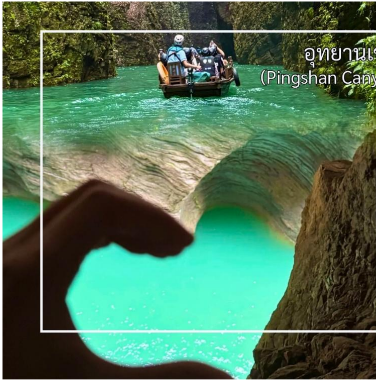
อุทยานเขาผิงซาน (Pingshan Canyon Scenic Area)