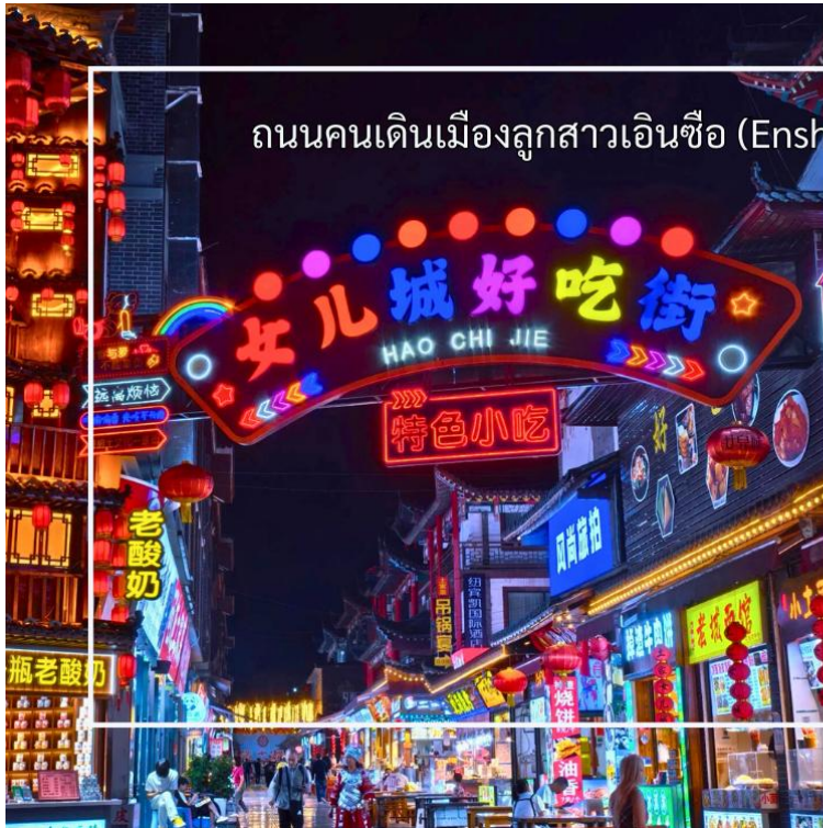
ถนนคนเดินเมืองลูกสาวเินซือ (Enshi Daughter City Pedestrian Street)

สมควรแก่เวลานำท่านสู่ ถนนคนเดินเินซือ (Enshi Daughter City Pedestrian Street) หรือเรียกอีกชื่อ ถนนคนเดินเมืองลูกสาวเินซือ เป็นศูนย์กลางกิจกรรมท้องถิ่นที่เต็มไปด้วยสีสันและวัฒนธรรมของเินซือ ถนนเส้นนี้เต็มไปด้วยร้านค้า ร้านอาหาร และแผงขายสินค้าพื้นเมือง ทั้งของฝาก งานหัตถกรรม และอาหารท้องถิ่น ทำให้นักท่องเที่ยวได้สัมผัสวิถีชีวิตของคนท้องถิ่นอย่างใกล้ชิด บรรยากาศในยามค่ำคืนมีชีวิตชีวา แสงไฟประดับถนนสวยงามตัดกับภูมิทัศน์เมืองเก่า และมีมุมถ่ายภาพสวยๆ ให้ผู้มาเยือนได้เก็บความประทับใจ