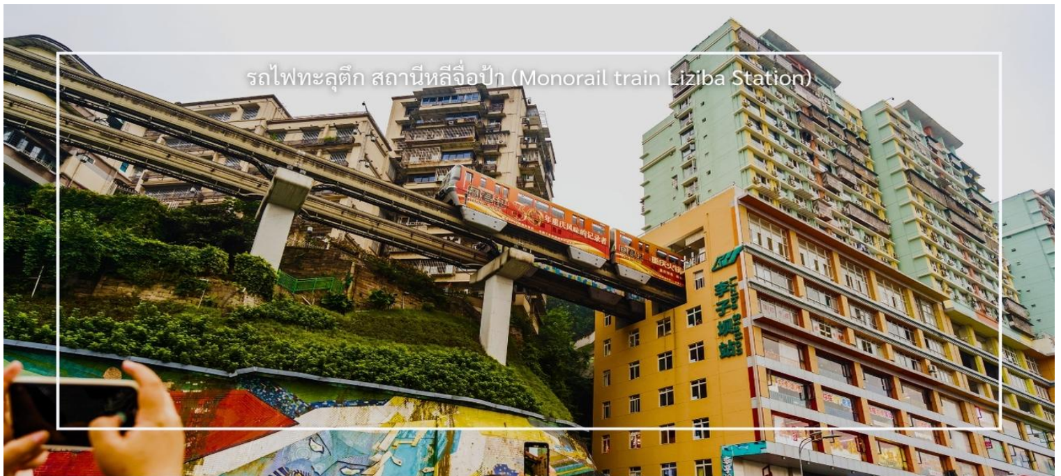
รถไฟทะลุตึก สถานีหลี่จื่อป้า (Monorail train Liziba Station)

นำท่านชม รถไฟทะลุตึก (Monorail Train) หนึ่งในแลนด์มาร์กที่สะท้อนความทันสมัยและเอกลักษณ์ของเมืองฉงชิ่ง รถไฟฟ้าโมโนเรลสาย 2 วิ่งทะลุผ่านตัวอาคารสูงอย่างน่าทึ่ง ซึ่งเป็นวิศวกรรมการสร้างสุดแปลกตา กลายเป็นปรากฏการณ์ที่โด่งดังระดับโลก ท่านสามารถชมและถ่ายภาพโมเมนต์สุดล้ำนี้จากมุมต่างๆ ของเมือง จุดชมวิวนี้นอกจากสร้างความตื่นตาตื่นใจ แต่ยังเป็นสัญลักษณ์ของการผสมผสานระหว่างเมืองสมัยใหม่กับภูมิประเทศที่มีภูเขาและแม่น้ำรายล้อม