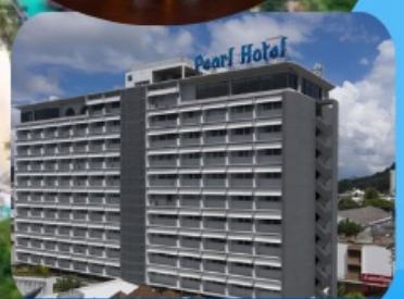
โรงแรมเพิร์ล