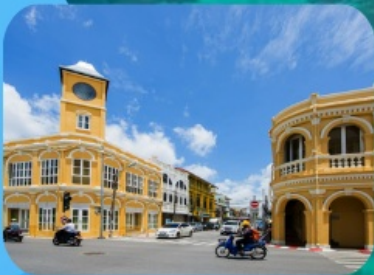
ภูเก็ตเมืองเก่า