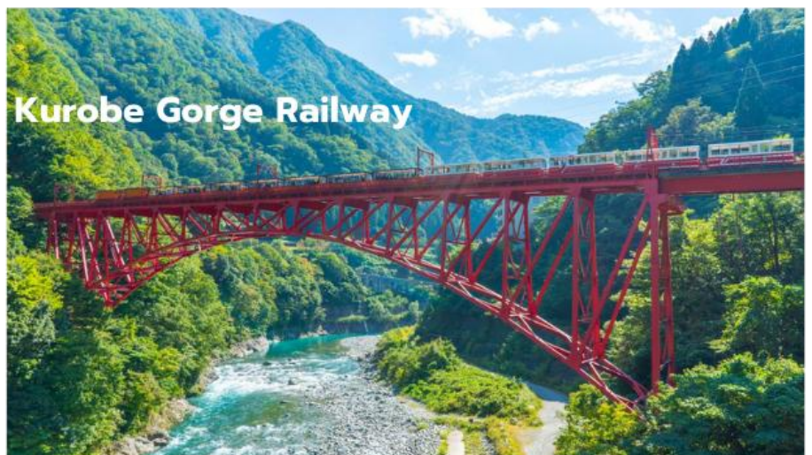
Kurobe Gorge Railway