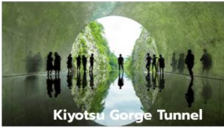
Kiyotsu Gorge Tunnel