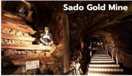
Sado Gold Mine