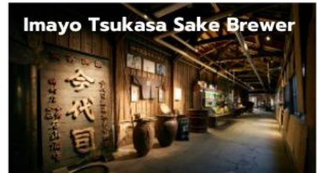
Imayo Tsukasa Sake Brewer