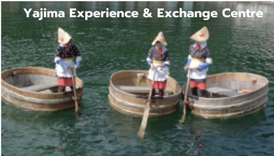
Yajima Experience & Exchange Centre