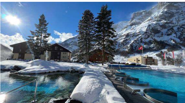
เมืองสปา Leukerbad