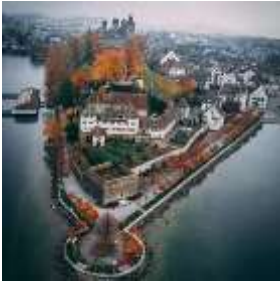
Rapperswil - Jona