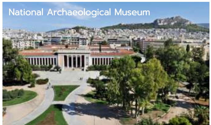
ยุคไมซีนี อียิปต์โบราณ และยุคคลาสสิก