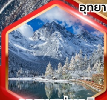
อุทยานแห่งชาติ ป่าฝิ่งโกว