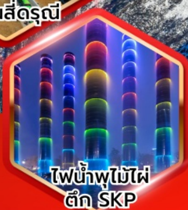
ไฟน้ำพุไม้ไฟ ตึก SKP