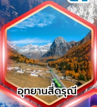
อุทยานสี่ฤดู