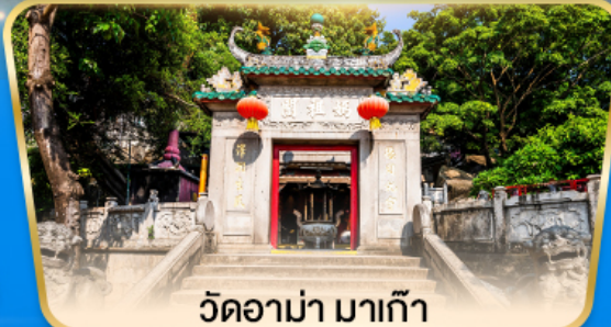
วัดอาม่า มาเก๊า