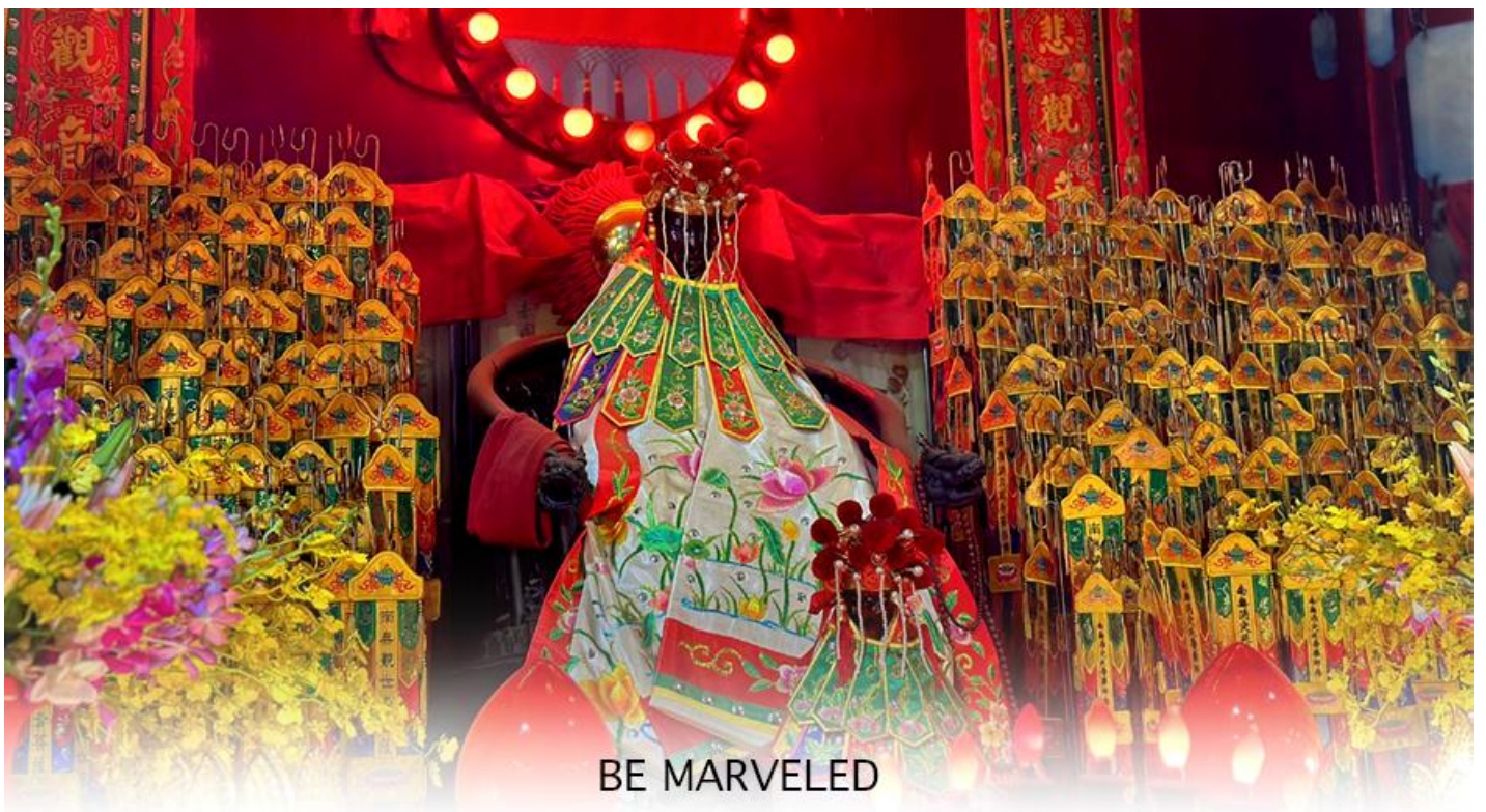
BE MARVELED วัดเจ้าแม่กวนอิมฮวงอ้า (ฮิมเมิน)

ให้เดินทางกลับไปกราบไหว้ และขอบคุณเจ้าแม่กวนอิมอีกครั้ง โดยเตรียมชุดไหว้ และกระดวยเงินกระดวยทอง ที่เป็นเหมือนเงินที่เรานำมาคืน เป็นการไหว้เพื่อคืนเงินเจ้าแม่กวนอิมนั่นเอง