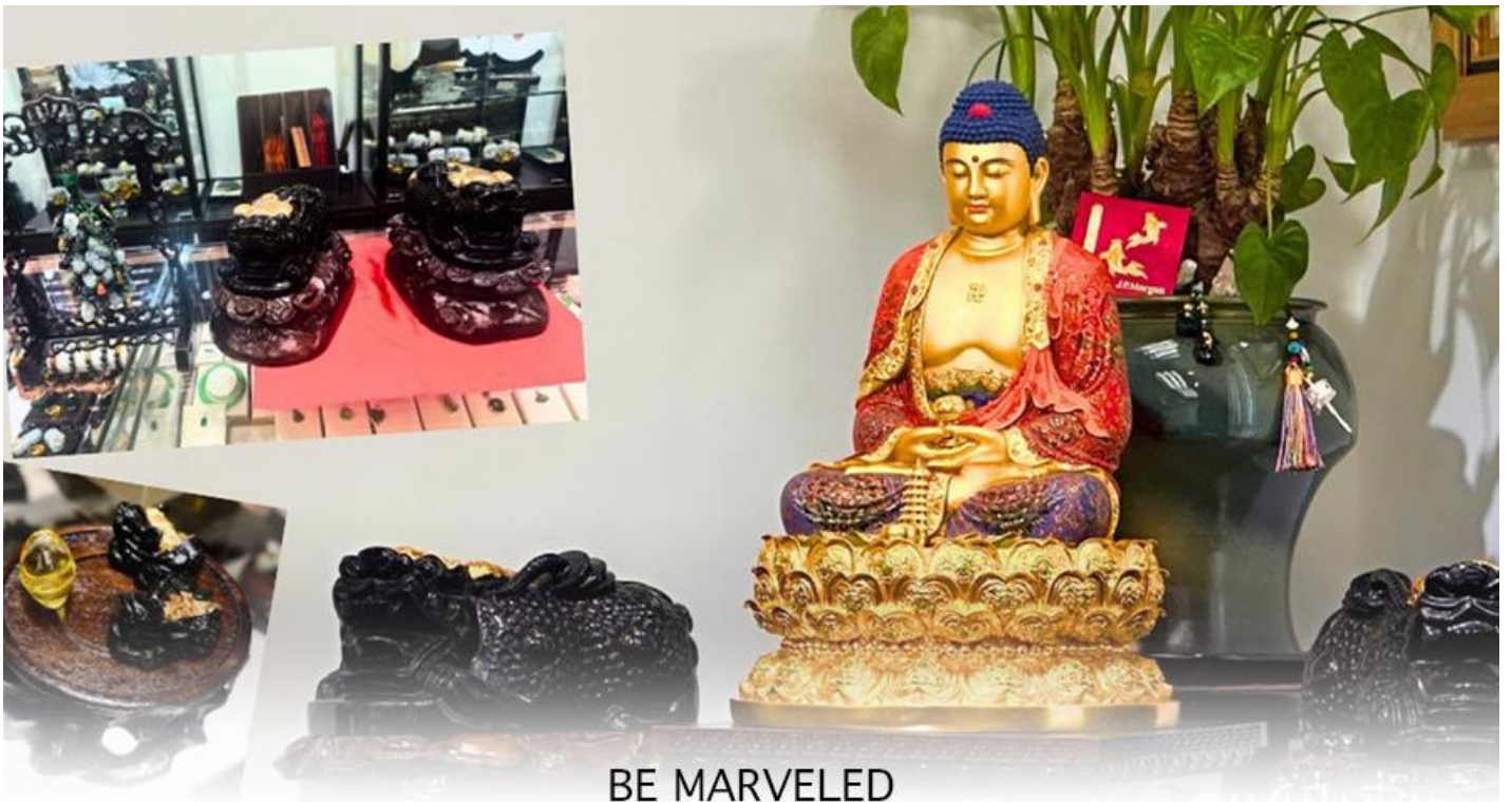
BE MARVELED ศูนย์ปี่เซี่ยะ

และนำท่าน ชม ศูนย์ปี่เซี่ยะ ซึ่งคนจีนนั้น ถือว่าหยกเป็นหิน ที่เป็นตัวแทนของความสวยงามและความบริสุทธิ์มีความเชื่อว่าหยก มงคล ถ้าพกติดตัวไว้จะอายุยืนและสุขภาพดีมีสินค้ำมากมายเกี่ยวกับหยก อาทิ กำไลหยก หรือสัตว์นำโชคอย่างปี่เซี่ยะ ให้ท่าน ได้เลือกซื้อเป็นของฝาก, ของที่ระลึก หรือของนำโชคแต่ตัวท่านเอง