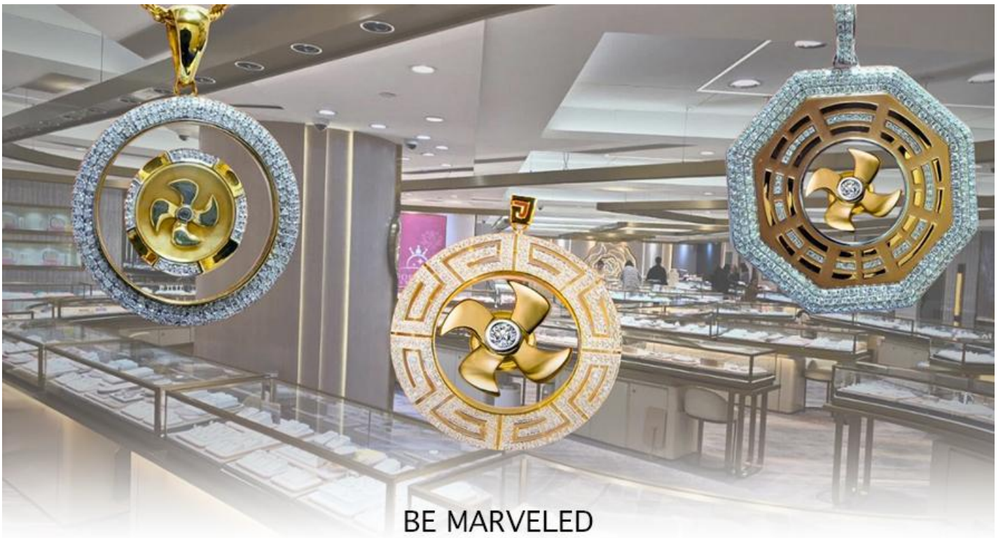
BE MARVELED ศูนย์ฮวงจุ้ย กัณฑ์เศรษฐี

และนำท่าน ชม ศูนย์ปี่เซี่ยะ ซึ่งคนจีนนั้น ถือว่าหยกเป็นหิน ที่เป็นตัวแทนของความสวยงามและความบริสุทธิ์มีความเชื่อว่าหยก มงคล ถ้าพกติดตัวไว้จะอายุยืนและสุขภาพดีมีสินค้ำมากมายเกี่ยวกับหยก อาทิ กำไลหยก หรือสัตว์นำโชคอย่างปี่เซี่ยะ ให้ท่าน ได้เลือกซื้อเป็นของฝาก, ของที่ระลึก หรือของนำโชคแต่ตัวท่านเอง