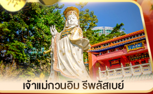
เจ้าแม่กวนอิม ธิพลสมัย