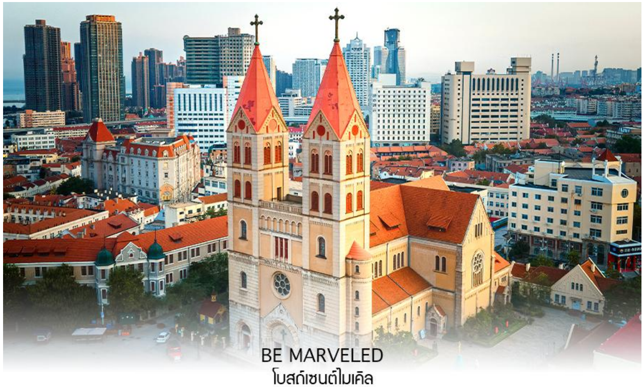
BE MARVELED โบสถ์เซนต์ไมเคิล