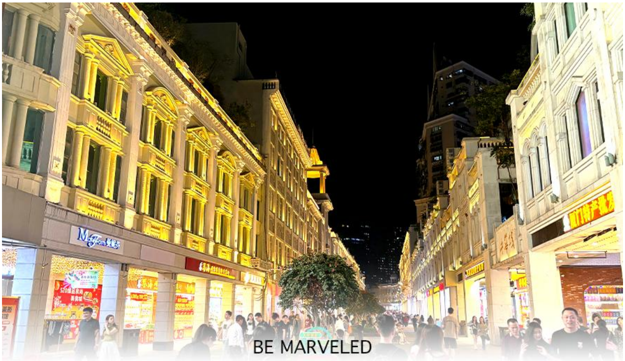
BE MARVELED ถนนคนเดินจงซานหลู่

จากนั้นนำท่านเดินทางไป ถนนคนเดินจงซานหลู่ เป็นถนนการค้าเก่าแก่ที่มีชื่อเสียง เป็นศูนย์กลางแฟชั่นและย่านช้อปปิ้งสำคัญของเมือง นอกจากนี้ ยังมี "สวนจงซาน" (Zhongshan Park) ซึ่งเป็นสวนสาธารณะขนาดใหญ่ใจกลางเมือง