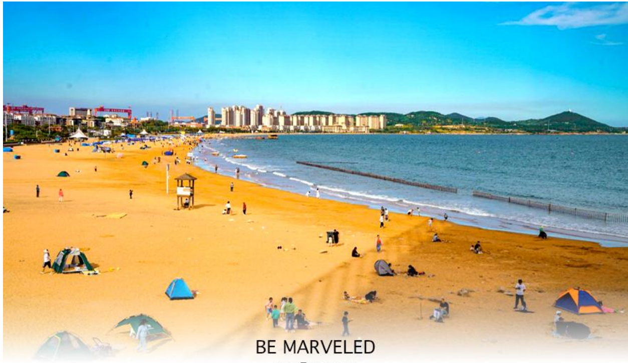
BE MARVELED หาดจินซาตาน

และชม หาดจินซาตาน ตั้งอยู่ในเขตหวงเต่า ของเมืองชิงเต่า มณฑลซานตง เป็นชายหาดที่ใหญ่ที่สุด และสวยที่สุดแห่งหนึ่งในเมืองชิงเต่า มีชื่อเสียงจากเม็ดทรายที่ละเอียดและมีสีเหลืองทอง ละเอียดระดับ น้ำทะเลใสสะอาดและมีกิจกรรมหลากหลาย เช่น ว่ายน้ำ วอลเลย์บอลชายหาด และ เครื่องเล่นทางน้ำ มีการจัดเทศกาลวัฒนธรรมและการท่องเที่ยวหาดทรายทองเป็นประจำทุกปี ในช่วงฤดูร้อน