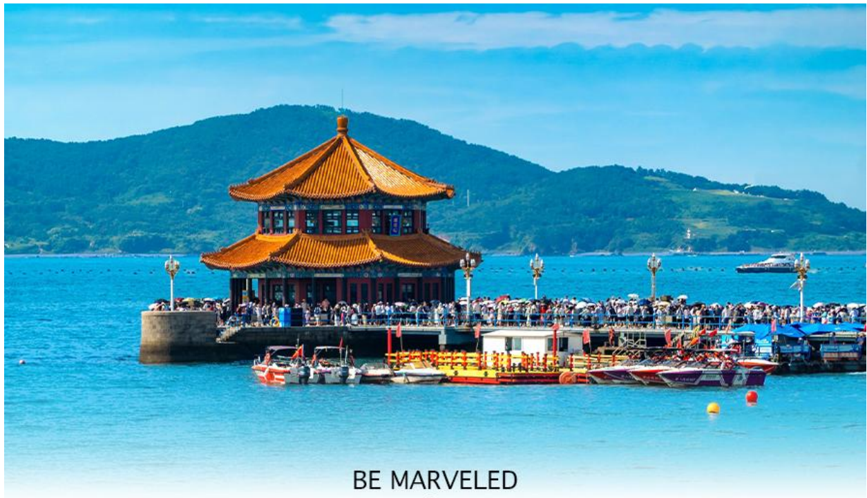
BE MARVELED สะพานจ้านเจียว

จากนั้นนำท่านเดินทางไป สะพานจ้านเจียว (Zhanqiao Pier) สะพานนี้สร้างขึ้นในสมัยราชวงศ์ชิง เมื่อปี ค.ศ. 1892 เพื่อใช้ขนส่งทางทหาร แต่ปัจจุบันกลายเป็นจุดชมวิว และมีการปรับปรุงขยาย สะพานเพิ่มจาก 200 เมตร เป็น 440 เมตร โดยปลายทางของสะพานเป็น ศาลาหุยหลาน (Hui Lan Ge) ทรงแปดเหลี่ยม 2 ชั้น คลุมด้วยกระเบื้องเคลือบสีน้ำตาล ภายในมีบันไดวน 34 ชั้น เมื่อขึ้นไปยังจุดชมวิวที่มองเห็นทะเลทอดยาวสุดสายตา ยังเป็นจุดที่นักท่องเที่ยวนิยมมาชมพระอาทิตย์ขึ้น และพระอาทิตย์ตก