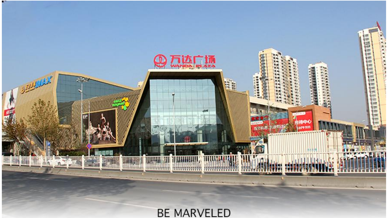
BE MARVELED ช้อปปังศูนย์การค้า (Qingdao Wanda Plaza)

ที่พัก HOLIDAY INN EXPRESS QINDAO หรือเทียบเท่าระดับ 4 ดาว