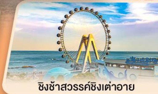
ชิงช้าสวรรค์ชิงเต่าอาย