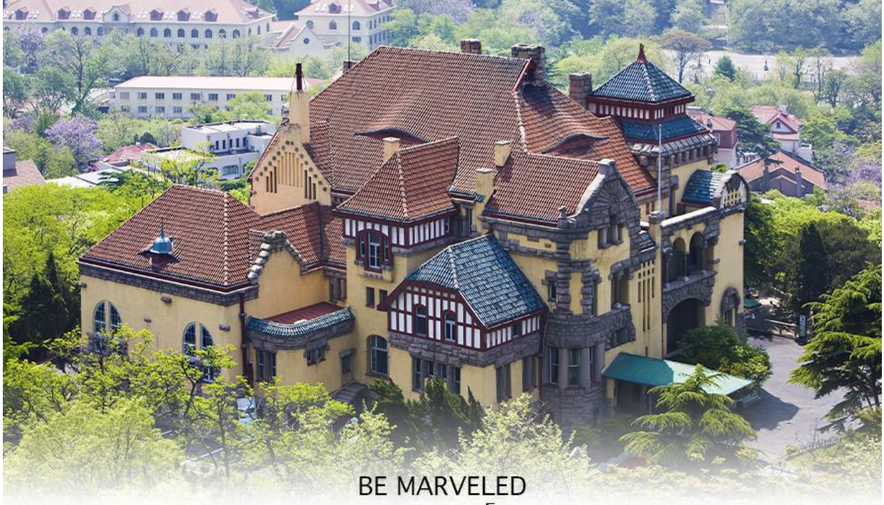
BE MARVELED พระตำหนักกรงูไหล