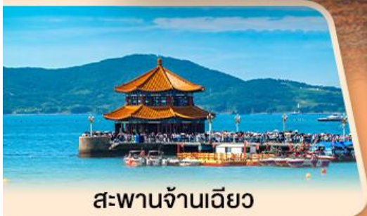
สะพานจันเจียว

ชายหาดซาจื่อโงว โรงงานเบียร์ชิงเต่า ชมทุ่งดอกพิงค์มอส ชายหาด NO.3