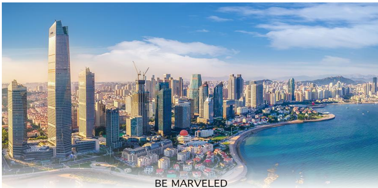
BE MARVELED เมืองชิงเต่า

02.25 น. ออกเดินทางสู่ สนามบินชิงเต่า โดยสายการบิน Shandong Airlines (SC) เที่ยวบินที่ SC4080 บริการ SNACK บนเครื่อง 07.58 น. เดินทางถึง สนามบินชิงเต่า เมืองชิงเต่าเป็นเมืองชายทะเลที่ตั้งอยู่ทางตอนใต้ของมณฑลซานตง ประเทศจีน มีชื่อเสียงจากบรรยากาศที่ผสมผสานระหว่างสถาปัตยกรรมสไตล์ยุโรปสมัยอาณานิคมกับความทันสมัยของจีนอย่างลงตัว เมืองนี้เป็นเมืองที่รู้จักในฐานะบ้านเกิดของเบียร์ชิงเต่า (Tsingtao Beer) ที่มีชื่อเสียงระดับโลก