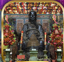
วัดปึกใต้