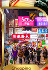
Shopping Tsim Sha Tsui