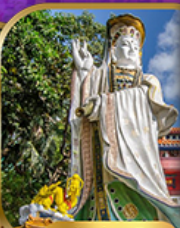
เจ้าแม่กวนอิม ริ้วลิลิตมัย