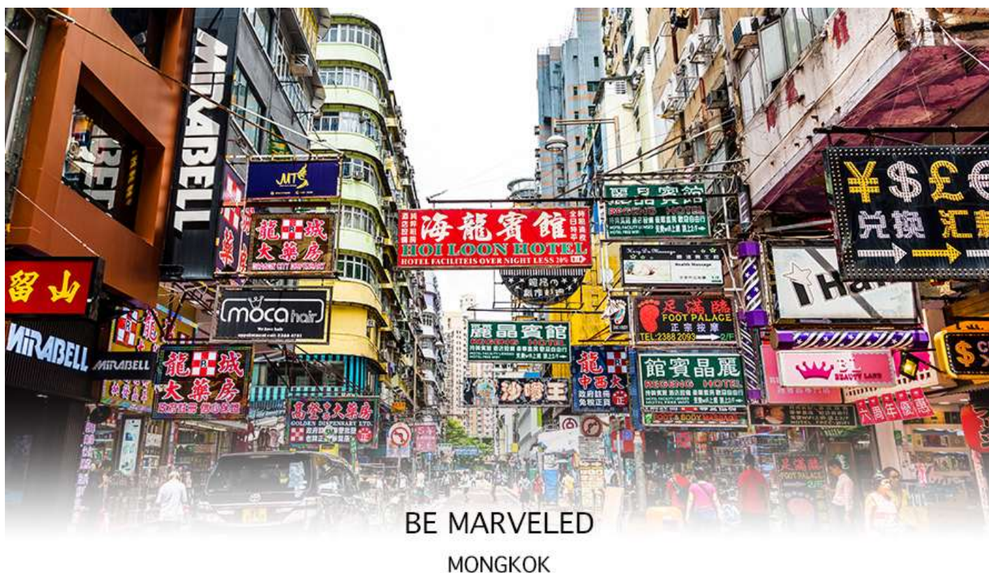
BE MARVELED MONGKOK

นำท่านเดินทาง ผ่านเส้นทางไฮเวย์อันทันสมัยข้ามสะพานแขวนชิงหม่า (TSING MA BRIDGE) ซึ่งเป็นสะพานแขวนสองชั้นที่ยาวที่สุดในโลก โดยมีความยาวทั้งหมด 2.2 กิโลเมตร (1.4 ไมล์) เชื่อมต่อระหว่างฮ่องกงอินเตอร์เนชั่นแนลแอร์พอร์ตกับตัวเมืองฮ่องกง ตัวสะพานชั้นบนจะเป็นทางให้รถยนต์วิ่ง ส่วนชั้นล่างเป็นเส้นทางของเอ็มทีอาร์ (MTR) และแอร์พอร์ตเอ็กเพรสเทรนส์ (AIRPORT EXPRESS TRAINS) สะพานชิงหม่านี้ ได้ถูกคัดเลือกให้เป็นสัญลักษณ์ของกรุงทั่วโลกอีกด้วย