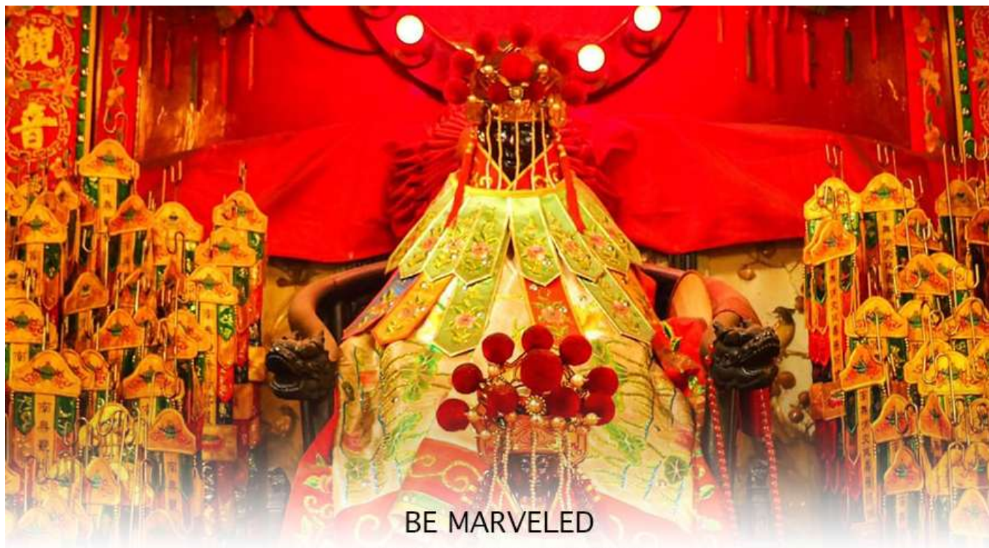
วัดเจ้าแม่กวนอิมฮองฮำ (ยิมเงิน)

ฉะนั้นการมาบูชาขอพรท่าน จะช่วยเสริมดวงไม่ให้เพลิงพลั่วแก่ศัตรู ทำให้มีมิตรที่ซื่อสัตย์ และคุ้มครองบริวารให้ก้าวหน้า และอยู่เย็นเป็นสุข ซึ่งผู้ประกอบอาชีพ ตำรวจ ทหาร และ นักการเมือง จึงมักจะนิยมบูชาเทพเจ้ากวนอู เป็นพิเศษ